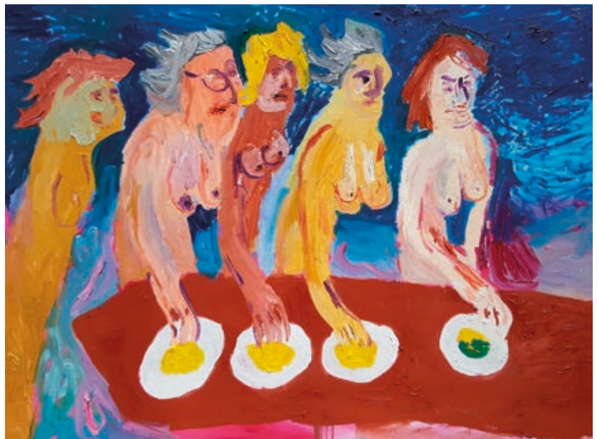
TANJA RITTERBEX: Önkiszolgáló, 2018, olaj, vászon, 90×120 cm

A kiállító galériák túlnyomó többsége Hollandiában működik, esetleg a szomszédos Belgiumban. Elszórtaan egy-egy galéria érkezett Svájcól, Ausztriából, Németországból, Dániából vagy Olaszországból. A holland galériák azonban külföldi művészeket is bemutatnak, és vételre ajánlják a műveiket. Az átlagos árszint ezeröttszáz és tízezer euró között mozog. Az amszterdami Althuis Hofland Fine Arts galéria anyagában figyeltem fel Waldemar Zimbelmann műveire. A művész Kazahsztánban született egy apró városkában, és szüleiével együtt kisiúként repatriált Németországba. Ott