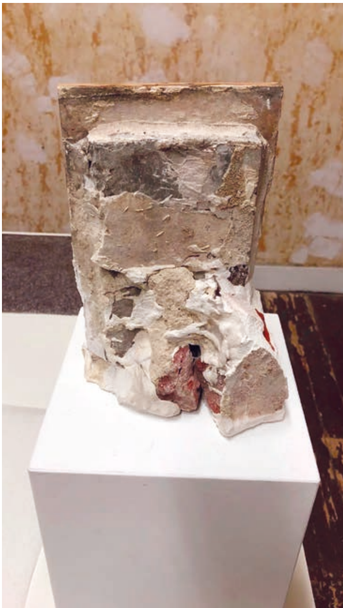
SERENA FINESCHI: Duplatest , 2020, beton, kerámia, vakolat, tégl, 16×23×11 cm A Montoro12 Gallery (Brüsszel, Róma) és a művész jóvoltából

Hofland mutatja be a holland Tanja Ritterbex műveit, például a nagy méretű olajképét, amely az Önkiszolgáló címet kapta