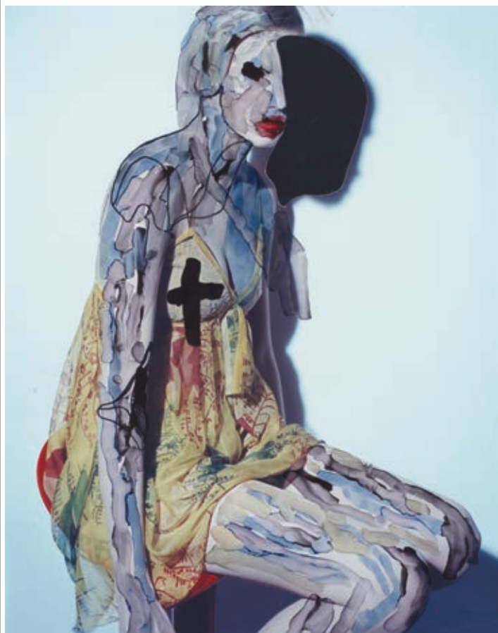
JEAN-FRANÇOIS LEPAGE: The Queen (III-I) , 2018, vegyes technika, c-print, 355×280 mm

„We oppose the idea of dead media. Although death of media may be useful as a tactic to oppose dialog that only focuses on the newness of media, we believe that media never dies. Media may disappear in a popular sense, but it never dies: it decays, rots, reforms, remixes, and gets historicized, reinterpreted and collected. It either stays as a residue in the soil and in the air as concrete dead media, or is reappropriated through artistic, tinkering methodologies.”