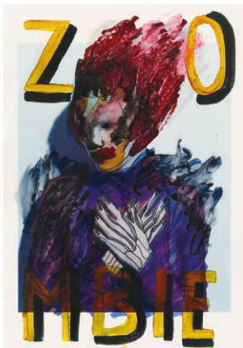
JEAN-FRANÇOIS LEPAGE: The King , 2018, vegyes technika, c-print, 458×316 mm, a TOBE Gallery jóvoltából