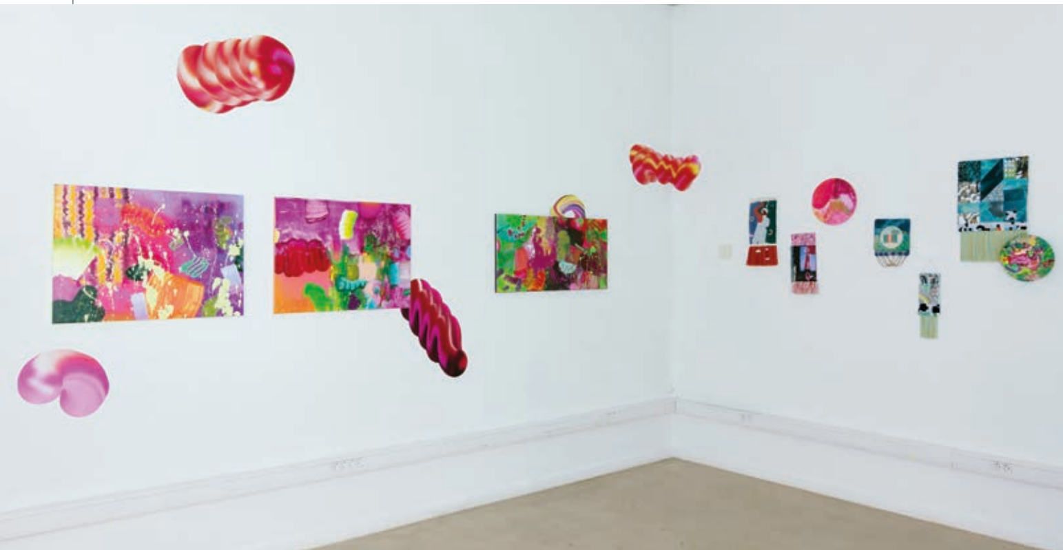
Installációs nézet, Elixir , 2020, BBB Art Space

festői minőségek, analóg és digitális eljárásokkal létrehozott elemek egymás mellé rendeléséből összeálló, zsigeri érzeteket, hangulatokat, íz- és illatasszociációkat keltő kompozíciók.