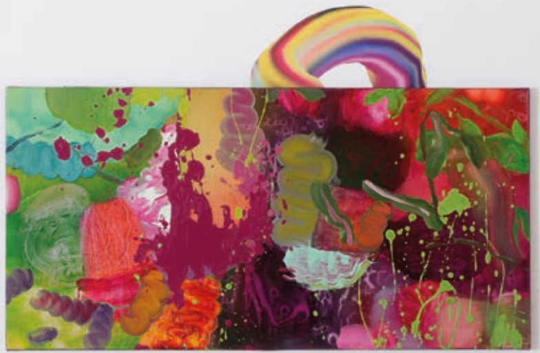
VETŐ ORSOLYA LIA: Funky (18PDL), 2019, olaj, vászon, 50×100 cm és Noodle (Szivárvány), 2019, digitális festmény, vinyl, változó méretek