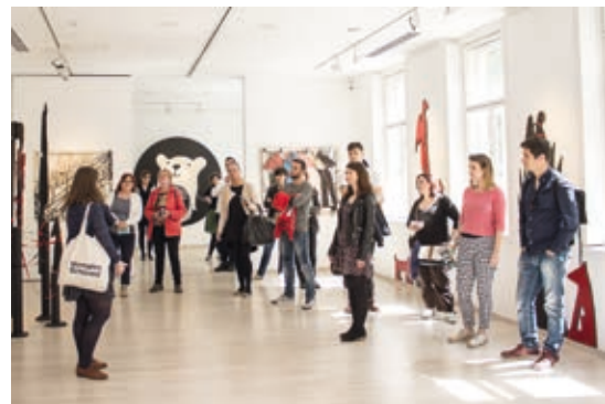
Tárlatvezetés, Budapest Art Week, 2019

Idén ötödik alkalommal érkezik az ország egyedülálló képzőművészeti eseménysorozata, a Budapest Art Week. Ezen hat nap alatt Budapest nélkülözhetetlen vizuális terei nyílnak meg különböző programokkal és kiállításokkal azzal céllal, hogy a lehető legváltozatosabb módon mutathassák be a haza vizuális művészet színe-javát. Közel 108 programon és 110 kiállításon vehetnek részt azok, akik heti vagy napi karszaggal akarnak a lehető legtöbbet beszívni magukba ebből a világból. Az idei évben is lesznek galériaséták, workshopok, tárlatvezetések és műterem-látogatások. Ezeket egészítik ki az Art+Cinemában tartott napi filmvetítések és a Liszt Ferenc Kamarazenekar minikoncertjei különböző teremben. A BAW központi kiállítása, a Jól hangzik! / Sounds so cool! a zene és a képzőművészet kapcsolatairól szól az Ybl Budai Kreatív Házban. Az eseménysorozat a Budapesti Tavasz Fesztivál hivatalos programja. További információk a www.bpartweek.hu honlapon.