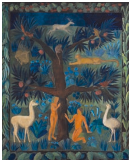
FERENCZY NOÉMI: Ádám és Éva , 1917, tempera, karton, 188×153 cm

A kiállítás a különleges szépségű szövött falikárpitok bemutatása mellett az ezekkel megegyező méretű kartonokon és színvázlatokon keresztül enged betekintést Ferenczy Noémi teljes életművébe és a rá jellemző különleges alkotói folyamatba. A most kiállított mintegy nyolcvan alkotás egy részét a Ferenczy Múzeumi Centrum gyűjteményének kiemelkedő és ritkán látható darabjai adják, de ezt kiegészítve számos magán- és közgyűjteményből is érkeztek művek Szentendrére.