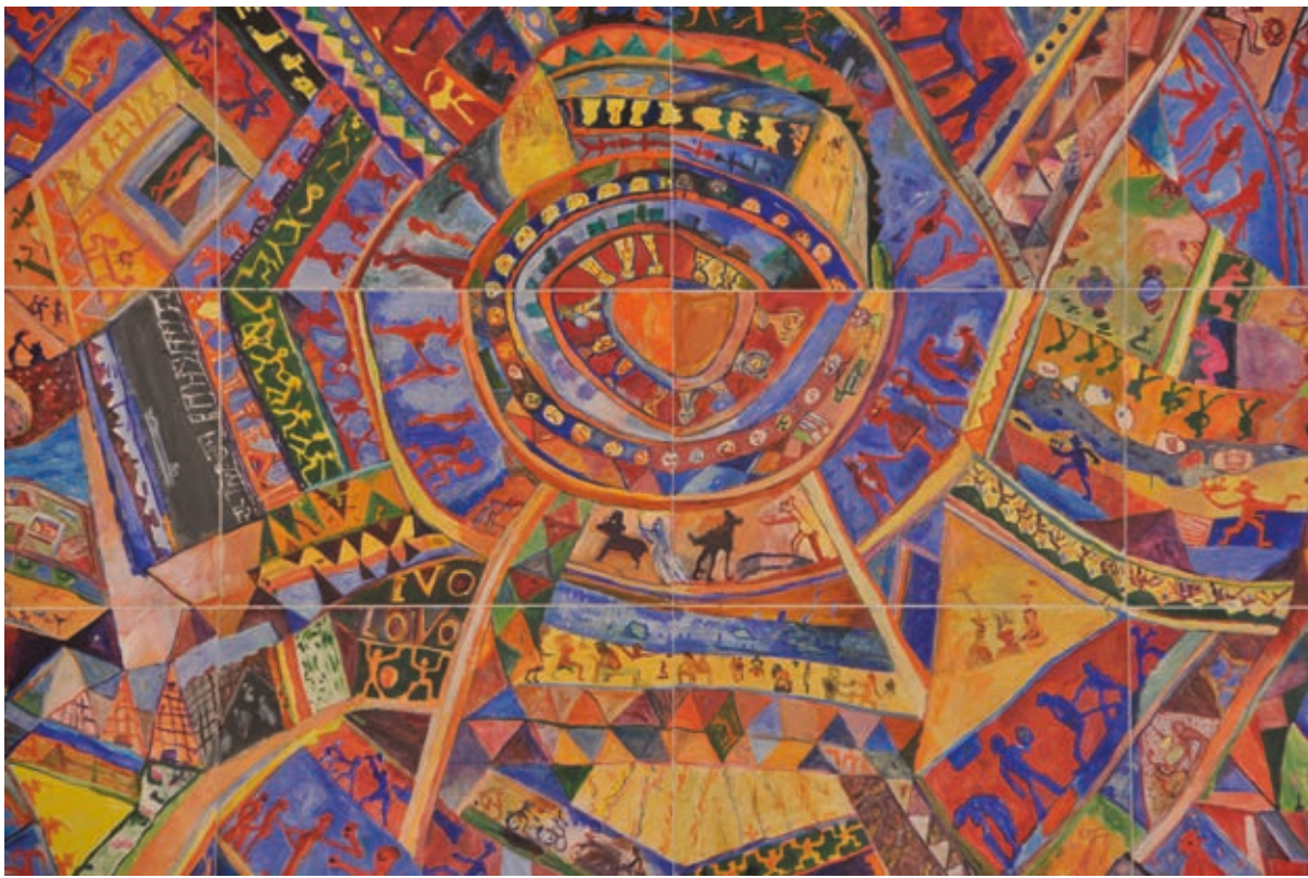
UJHÁZI PÉTER: Vasárnapi tapéta (Szőnyeg) , 2010, akril, papír, 210×400 cm, HUNGART ©2020