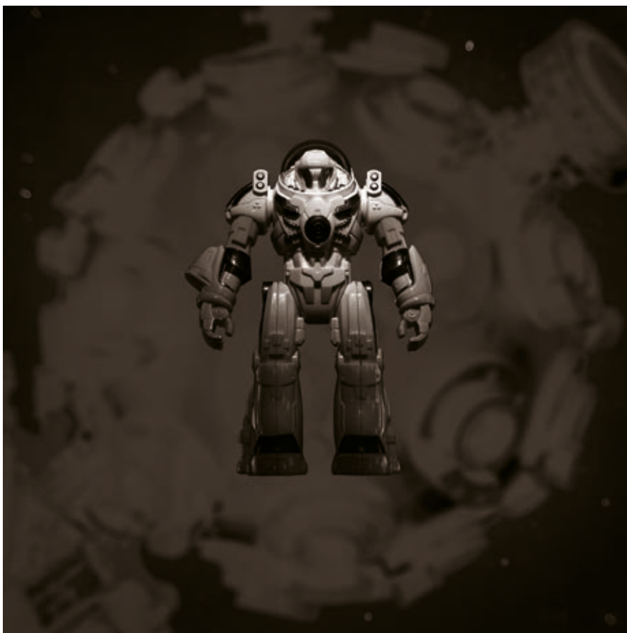
DEIM BALÁZS: Robonaut (Space) , 2019, giclée-print, 60×60 cm