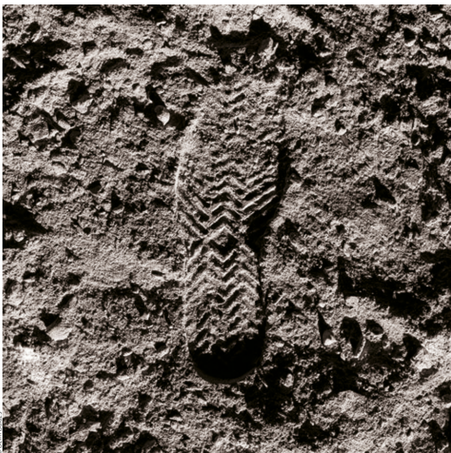
DRÉGELY IMRE: Apollo 11 (Holdudvar) , 2019, c-print ponyván, 140×140 cm