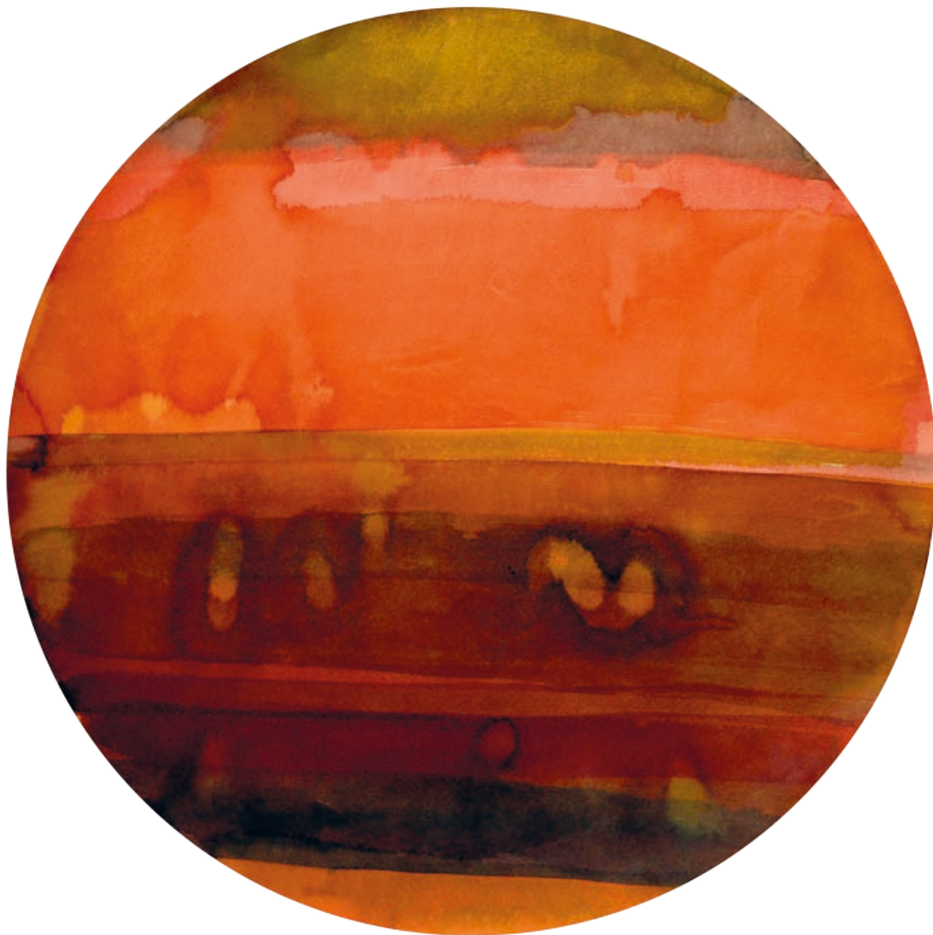
KEREKES GYÖNGYI: Írisz , akvarell, papír, ø 50 cm

természet mint a transzcendencia itthonléte és a női lét mint a személyes történések kerete. A növények, a falevél sok formában jelent meg munkáiban az évek során: performansz kellékeként, szóttesként, installációként, fotóként, részletrajzként és elvont formaként. A levél reprezentációja megunhatatlan – nincs két egyforma levél, mondta Leibniz. A levél talán a legszerényebb megjelenési formája a spirituális elvnek, ahol már van élet, de még nincs küzdelem, erőszak, a másik elpusztítása. A levél esetében még az elmúlás is gyönyörű: nincs görcs, nincs haláltusa, csak a színek pompája.