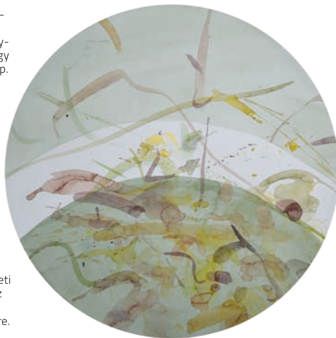
KEREKES GYÖNGYI: Spirituális kertek 4. , 2000, színes tus, papír, ø 50 cm

A feladat nem azért lehetetlen, mert felül kellene múlnia például Michelangelo ábrázolását, hanem azért, mert Kerekes Gyöngyi egy elvont