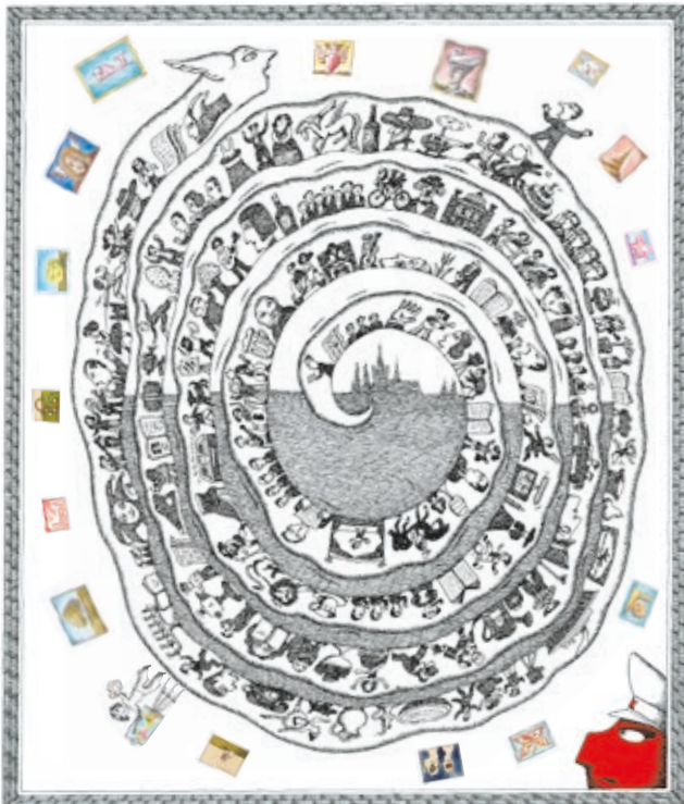
1968 a prágai tavasz éve!