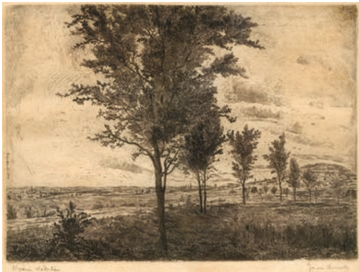
GROSS ARNOLD: Nyári délután , 1954, papír, rézkarc, 240×320 mm

Az eljárással magyarázható, hogy egy lemezről többféle színű – barna, kék, fekete – levonat is készülhet ( Napraforgók , 1966).