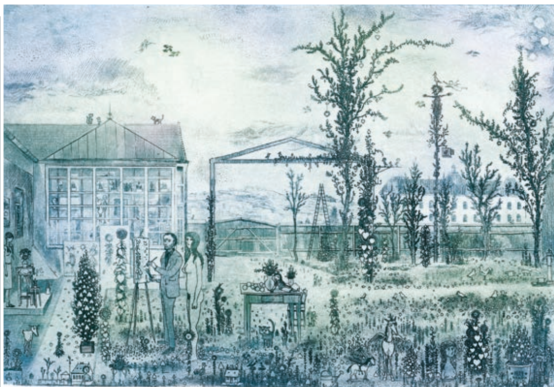
GROSS ARNOLD: Tordai műterem I. , papír, rézkarc, 165×225 mm, Gross Arnold Archívum, HUNGART ©2020

Széphárom Közösségi Tér, 2020. I. 31-ig Miskolci Galéria, Kondor-terem, 2020. II. 20. – IV. 18.