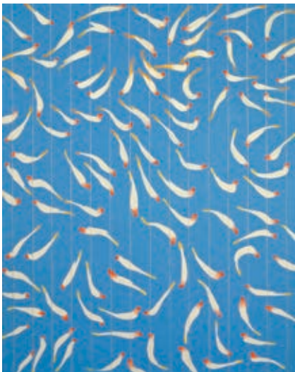
SZABADOS ÁRPÁD: Madaras III. , 2005, akril, vászon 200×160 cm

Szabados Árpád, a Szegeden született Munkácsy Mihály-díjas festő grafikus művészetével hatalmas utat járt be. Életében az alkotás mellett kiemelt szerepe volt az oktatásnak is, több hazai és külföldi egyetemen tanított, valamint alapítója volt a Magyar Nemzeti Galéria GYIK Műhelyének is. Rendkívül termékeny művész, munkássága során csaknem kilencven egyéni tárlata nyílt, és háromszáz nemzetközi, illetve hazai kiállításon vett részt. A REÖK-ben nyíló tárlaton több mint 200 alkotás látható, melyek között festmény, grafika, rézkarc, fotó és linómetszet is található. A szegedi, életmű jellegű kiállítás nagy hiányt pótol a hazai képzőművészeti életben. Katartikus élményt adó alkotásain rejtélyek hosszú sora vár megfejtésre a palota mindkét szintjén.