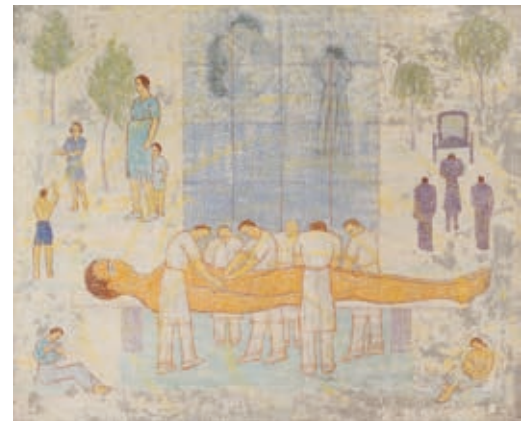
MATTIS TEUTSCH JÁNOS: Élet és halál , 1947, kazeintempera, vászon, 80×95 cm Rechnitzer János gyűjteménye

A Kassák Múzeum kiállítása Miklós Szilárd kortárs művész kutatása és koncepciója alapján Mattis Teutsch kései művészetéhez kínál új olvasatot. A kiállításra romániai és magyarországi múzeumokból, magángyűjteményekből és a családi hagyatékokból főként olyan műveket válogatott a kurátor, amelyeket a közönség eddig még nem látott. A kiállítás a Fundația9 együttműködésével valósul meg, amelynek bukaresti kiállítóhelyén 2019 őszén mutatkozott be az anyag.