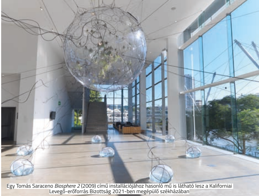
Egy Tomás Saraceno Biosphere 2 (2009) című installációjához hasonló mű is látható lesz a Kaliforniai Levegő-erőforrás Bizottság 2021-ben megépülő székházában