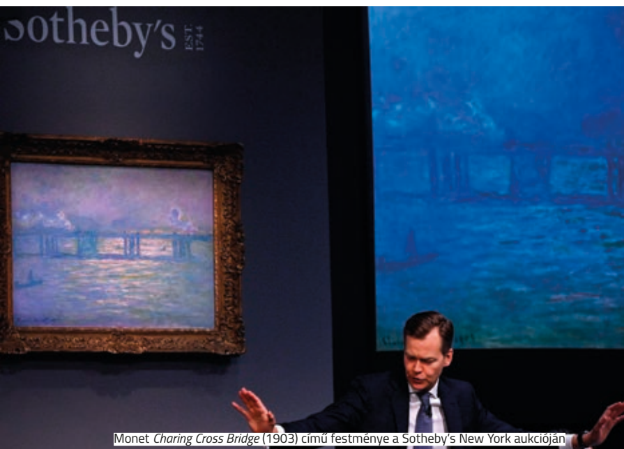
Monet Charing Cross Bridge (1903) című festménye a Sotheby's New York aukcióján

A Sotheby's New York szezonnyitó novemberi aukciójának legjobban várt licitje Monet Charing Cross Bridge című festménysorozatának egyik 1903-ban elkészült darabja volt, amely az előzetes becslésekhez közeli áron, 27,6 millió dollárért, vagyis majdnem 8 milliárd forintért kelt el. Az aukciósház a közleményében megemlítette, hogy a sorozat egy másik festményét még 1992-ben mindössze 4,1 millió dollárért értékesítették, ami a mostani árverés eredményét tekintve szinte jelentéktelennek tűnik.