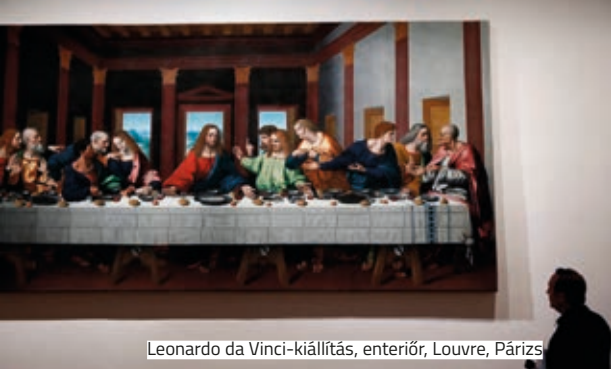
Leonardo da Vinci-kiállítás, enteriőr, Louvre, Párizs