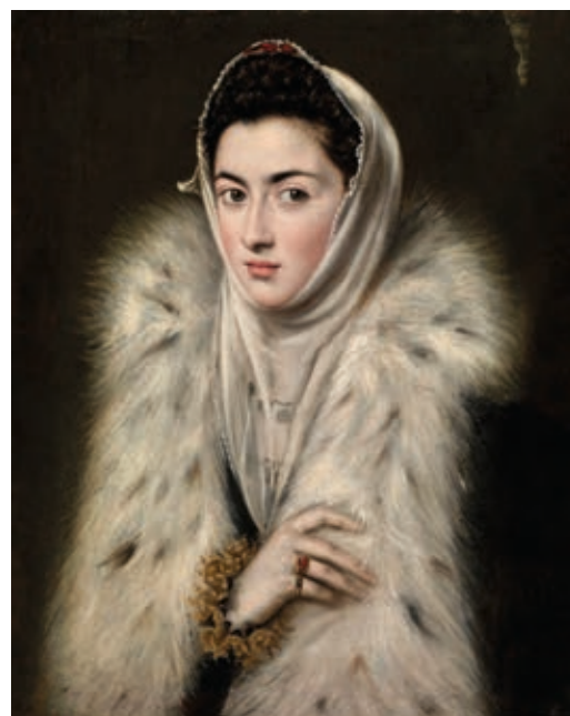
Alonso Sánchez Coello: Hölgy prémsállal (Lady in a Fur Wrap), 1577–1579, olaj, vászon, 62x50 cm

Skócia egyik büszkeségéről, a Glasgow Múzeumban kiállított Hölgy prémsállal című festményről a közelmúltig úgy gondolták, hogy a 16. században festette a spanyol mester, El Greco. A madridi Prado Múzeum kezdeményezésére azonban technikai vizsgálatnak vetették alá a művet, amelynek eredményeképpen megállapították, hogy azt valójában Alonso Sánchez Coello alkotta, aki II. Fülöp spanyol király udvarának hivatalos festőjeként jóval elismertebb volt, mint kortársa, El Greco. A mű a vizsgálatok lezárása után jövő nyáron kerül újra kiállításra Glasgow-ban.