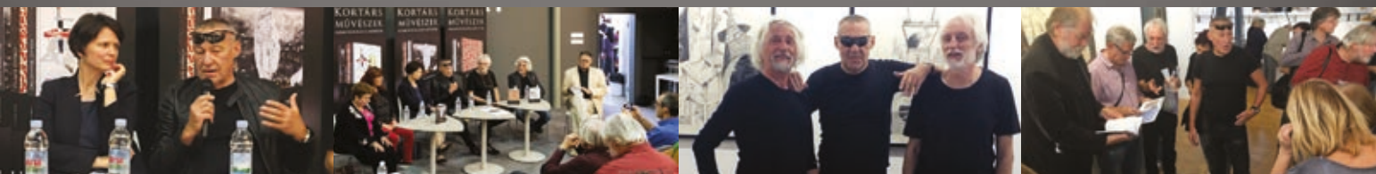
HUNGART könyvbemutató, ArtMarket, Millenáris, 2018. október