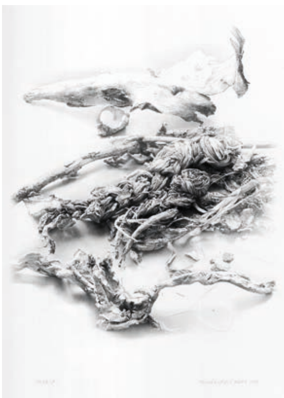
ARANYÁSZ ZITA: Occam vágása , 2019, ceruza, papír, fémváz, térgrafika, 40×20 cm