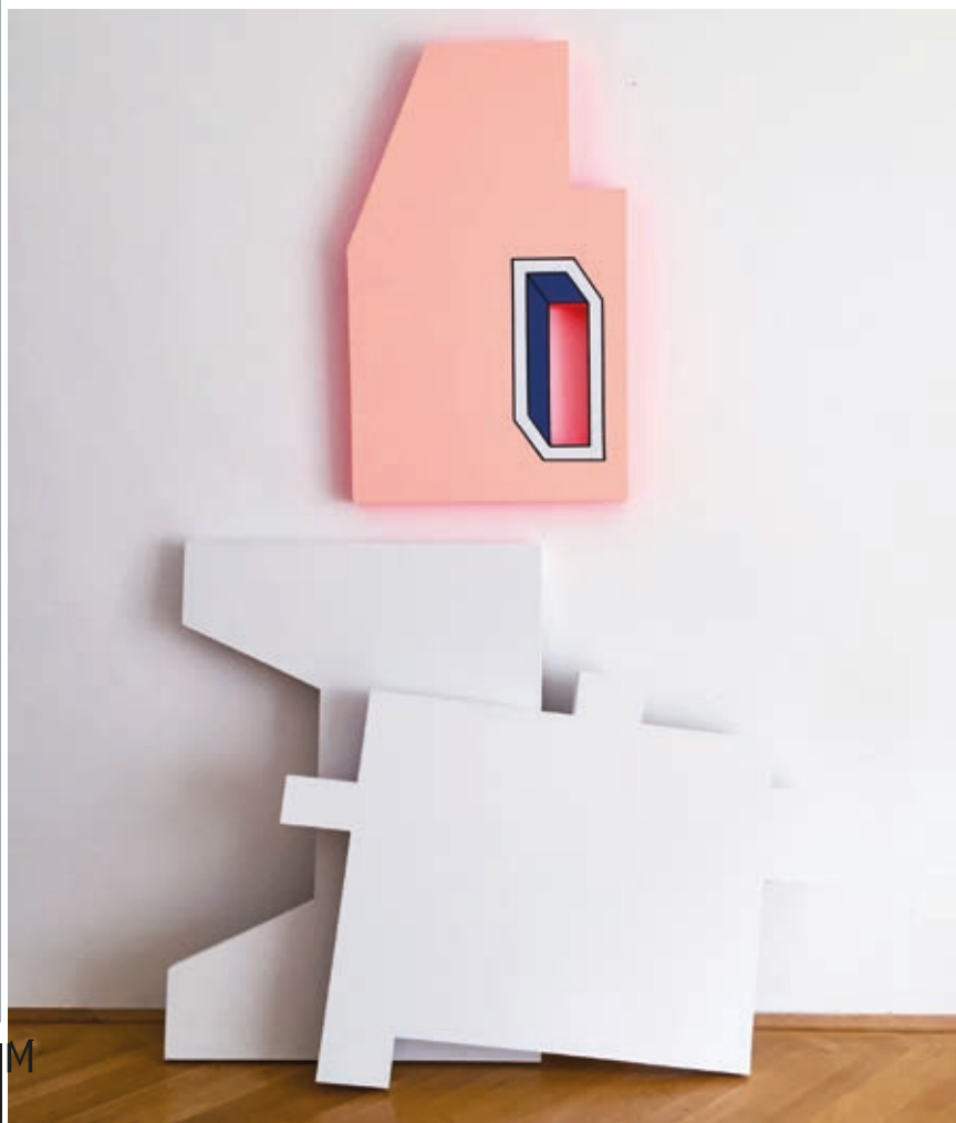
HORVÁTH LÓCZI JUDIT: The Jump , 2019, akril, vászon, MDF-lap, fa, 80×50×5 cm