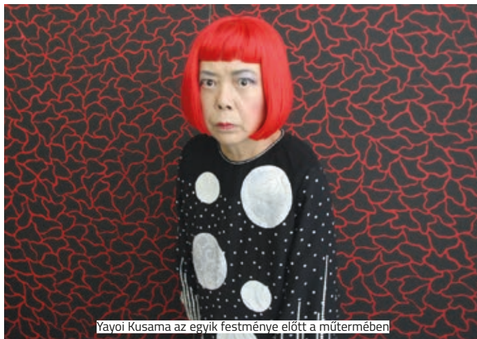
Yayoi Kusama az egyik festménye előtt a műtermében