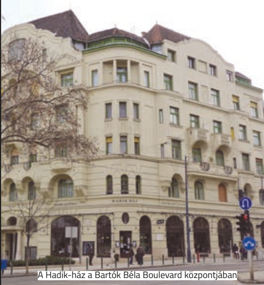
A Hadik-ház a Bartók Béla Boulevard központjában