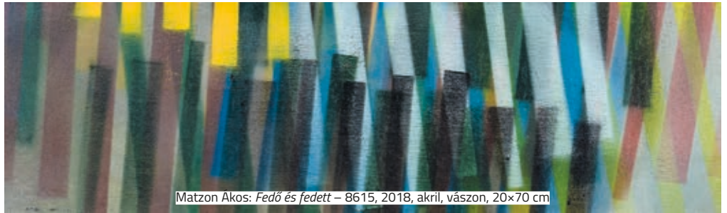
Matzon Ákos: Fedő és fedett – 8615, 2018, akril, vászon, 20x70 cm

Lazán, közel párhuzamosan futó, rivalizáló, néhol egymást keresztező, egymás alá vagy fölé keveredő színes vonalsávok, szövedékek kapcsolódnak egymásba és töltik ki rendezett rendetlenségben a képmezőt. A festészet egyik kérdésére keresik – válasz nélkül – a megoldást: ábrázolhatók-e objektíven a tér dimenziói a sík felületen? Az is felvetődik, hogy ez a (mozgás)tér egyáltalán létezik-e? A képsorozatot végigszemlélve maradhatunk abban a boldog, naiv illúzióban, hogy igen, az emberi létben a valóságos és szellemi tér szabadon rendelkezésünkre áll. Matzon Ákos Munkácsy-díjas festőművész kiállítása 2019. október 18. és november 10. között látható a Klebelsberg Kultúrkúriában.