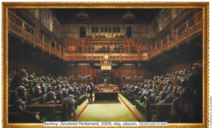
Banksy: Devolved Parliament , 2009, olaj, vászon, HUNGART © 2019

A titokzatos Banksy nem csak street art műveket alkot. Egyik leghíresebb, Devolved Parliament című festménye október elején kerül kalapács alá a Sotheby's árverésén. Az előzetes becslések szerint a mű 1,5–2 millió fontért (mintegy 560–750 millió forintért) is elkelhet, így várhatóan ez lesz majd Banksy legdrágább műve. A négy méter széles festményt 2009-ben a Bristol Múzeumban láthatta a nagyközönség. A tárlat hatalmas siker volt, több mint 300 ezer látogatót vonzott. Talán nem véletlen, hogy a mű éppen idén került elő újra: ismeretlen tulajdonosa esetleg a Brexit-vita visszhangját kihasználva próbálja felszófolni az árát, hiszen a téma ma aktuálisabb, mint valaha.