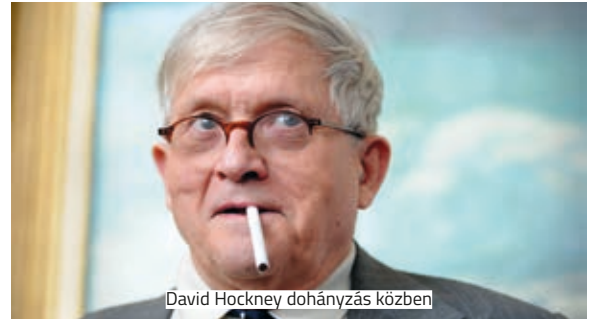
David Hockney dohányzás közben

A brit kortárs festő végleg megelégedte, hogy Los Angelesben nem élhet korlátlanul szenvedélyének, a dohányzásnak, ugyanis az amerikai nagyvárosban még az éttermek és bárók előtt sem szabad rágyújtani. A művész ezért Normandiába költözött, ahol kedvére festhet és dohányozhat. Franciaországi otthona azonban nem csak amiatt bűvölte el, hogy akkor gyújt rá, amikor akar. Gyönyörű kertjének olyannyira megszállottja lett, hogy szinte minden négyzetcentiméterét megrajzolta La Grande Cour (A nagy udvar) című, 24 panelből álló művében, amelynek megalkotásában a kínai tekercesek illusztrációi és a bayeux-i falikárpit is inspirálta.