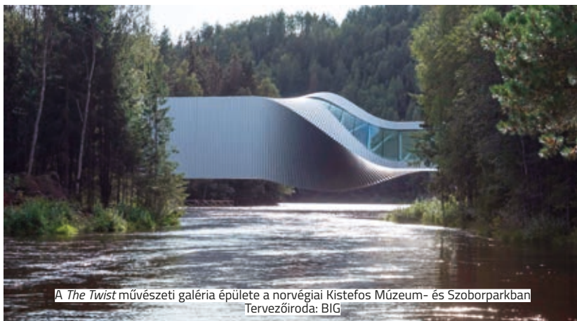
A The Twist művészeti galéria épülete a norvégiai Kistefos Múzeum- és Szoborparkban Tervezőiroda: BIG