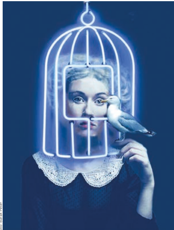
OLIVER ARTHUR: Légy , 2018, vászon, akril, 120×100 cm HUNGART © 2019