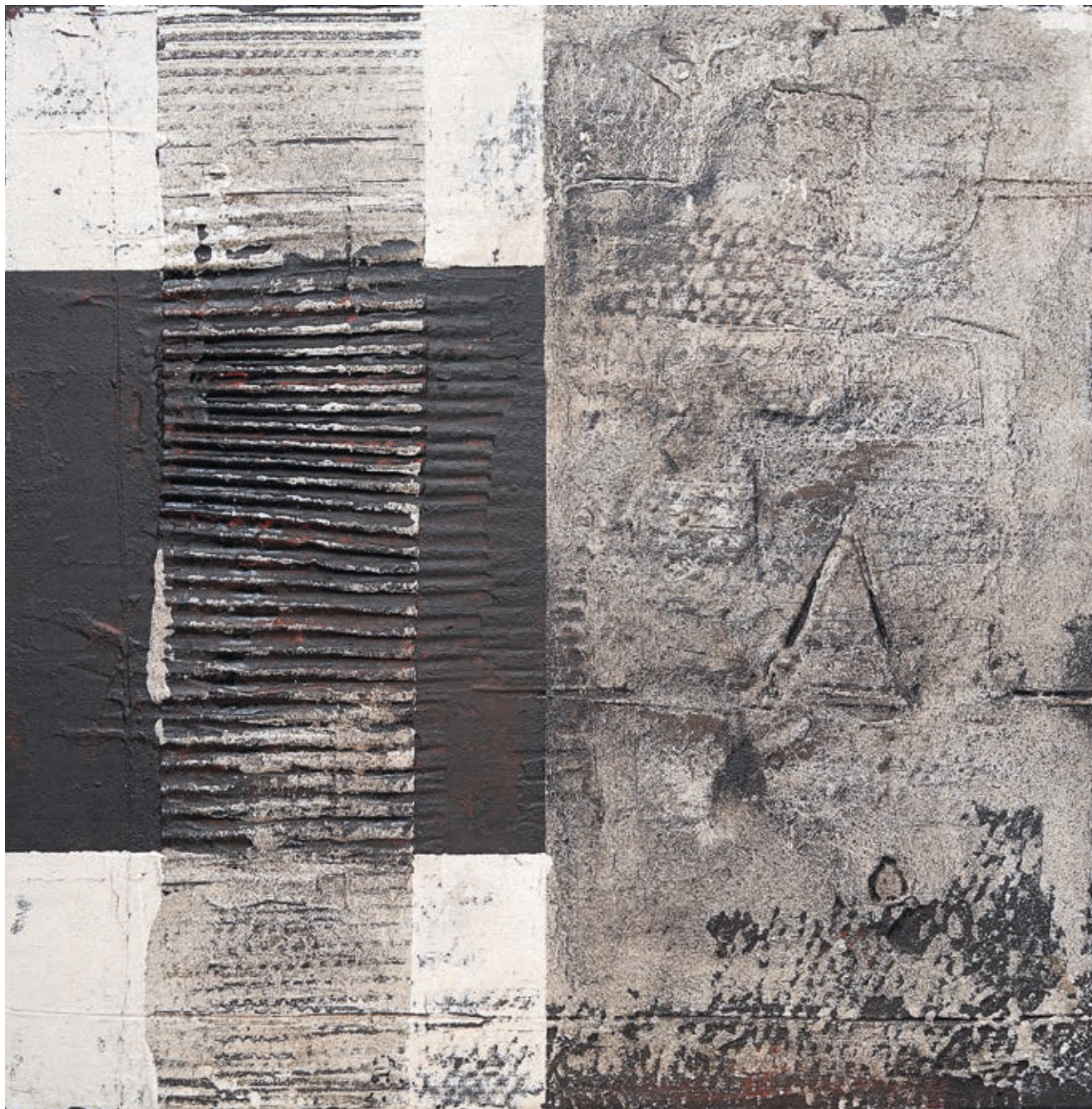
SZÉKÁCS ZOLTÁN: Üzenet a falon , 2019, vászon, vegyes technika, 50x50 cm, HUNGART © 2019

a természet formai jelenségeinek gazdagságára vonatkozóan változatos anyagot találunk a kiállított művek között. A transzcendens dimenzió nem mindenütt köthető a szakralitáshoz, sok esetben inkább a tudományos felfedezésekhez kapcsolódó képzetekre, eddig ismeretlen dimenziók megsejtésére fókuszáltak az alkotók.