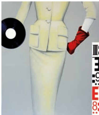
HEGEDŰS 2 LÁSZLÓ: Modellkép , 2014, 110×93 cm

Hegedűs 2 László, munkáit tekintve, leginkább a Bálint Endre-i, kissé groteszk montázstechnika folytatójának tekinthető. A kollázsában és montázsában egyfajta posztszürrealista gondolkodás jellemző. Gyakran használ kiegészítő objektet: a gomb (a csoportképeken az arcok ekvivalensei), a bakelitlemezt, a dominó, a cseresznyeszem, a mérőlécs stb. szerves részévé válik a képnek. A többszólamúság érvényes művésztéere. A vizuális műfajokból és az irodalomból egyaránt merítő gondolkodása és eszközhasználata túlmutat a hagyományos műfajokon. Hegedűs 2 ezt így fogalmazza meg: „Ahhoz, hogy a matematikában 2 legyen a végeredmény, végtelen variáció létezik. Ezeket a verziókat én vizuálisan, intuitív módon végzem el, aminek eredménye a kép. A színek és formák a képen lehetnek bonyolultabb és egyszerű viszonyban, ugyanúgy, mint egy matematikai számítás vizuális lenyomatai az iskolai táblán.” Hegedűs 2 László manuális műveleteinek és vizuális képleteinek végeredménye a mostani kiállításon látható.