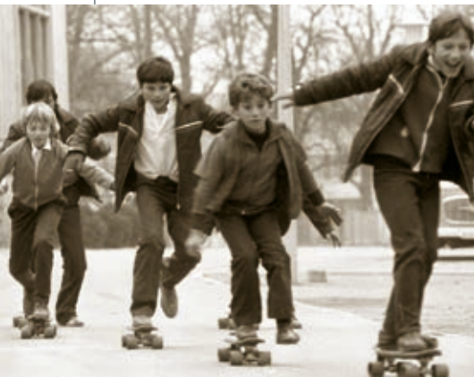
Tiszadob, Andrassy kastély, 1983, URBÁN TAMÁS felvétele, Fortepan 125965

A tárlat a gördeszkázás fejlődését, a design történetét, a mozdulatok, trükkök kialakulását vizsgálja eredeti tárgyak, archív fotók és filmfelvételek, valamint az alkalomra készített rövid interjúfilmek segítségével. A gördeszkás kultúra budapesti történetén keresztül a látogató megtudhatja, hogy a hobbi iránti elkötelezettség milyen áldozatvállalásokhoz (mint például a testi épség kockáztatása), leleményességhez vezet a rendelkezésre álló lehetőségek kihasználásával.