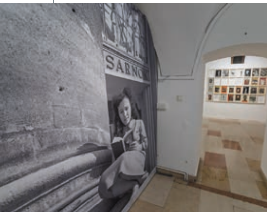
A kiállítás részlete. Olvasó lány , SÁNDOR GYÖRGY felvétele, 1958, FSZEK Budapest Gyűjtemény, Fortepan 116811

A hatvan évvel ezelőtti „tolvajok” és látogatók között nagy számban szerepeltek főiskolás művészek és művészettörténet szakos egyetemisták, akik a következő évtizedekben szakmájuk kiemelkedő képviselőivé váltak. A velük rögzített interjúk az 1950-es, 1960-as évekre vonatkozó páratlan, színes forrásanyagot alkotnak, amelyből a kiállításon részletek tekinthetők meg.