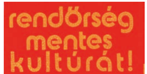
Az INCONNU CSOPORT matricája, az 1980-as évek közepe

Az Orfeo és az Inconnu élet és művészet egyesítésére tett kísérletein, politikai és ideológiai elvein, az amatőr művészethez való kapcsolódásain és a férfi-női viszonyain keresztül láthatóvá válik, hogy a két csoport története több, mint történeti érdekesség. A rendszerkritikus, az állammal és a művészeti élet szabályaival összeütközésbe kerülő pályakezdő művészek története mindenki számára ismerős lehet. Ezért a kiállítás nemcsak a Kádár-kori politikai és kulturális aktivizmusról, hanem ennek az utóéletéről és mai lehetőségeiről is beszél.