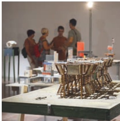
Részlet a kiállításból, Kortárs Művészeti Intézet (ICA-D), Dunaújváros, 2019