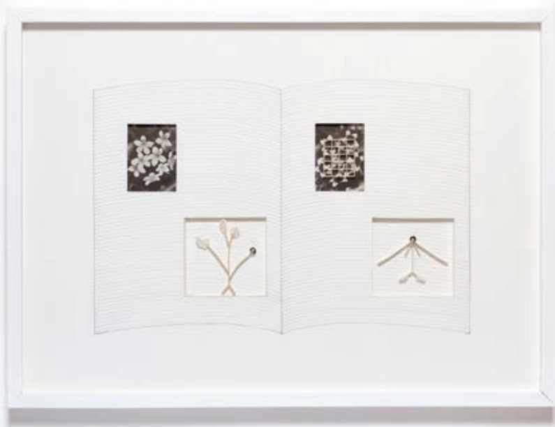
TRANKER KATA: Változó nézőpont I. , 2018, papír, ceruza, fotó, fa, plextol, 50x70 cm