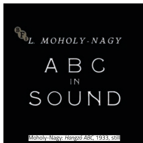
Moholy-Nagy: Hangzó ABC , 1933, still