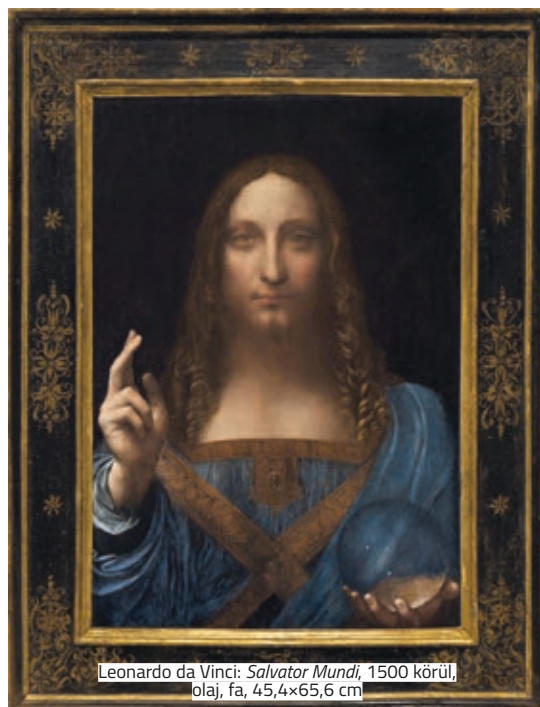
Leonardo da Vinci: Salvator Mundi , 1500 körül, olaj, fa, 45,4×65,6 cm

A műtárgyakkal foglalkozó szakoldal, az Artnet biztos forrásokra hivatkozva erősítette meg, hogy a 2017-ben a Christie's árverésén elkelt (véltően) Leonardo da Vinci-remekművet, a Salvator Mundi -t a szaúd-arábiai trónörökös, Mohammad bin Salman Szirén nevű luxusjachtján őrzik. A minden idők legdrágábbjában, 450 millió dollárért elkelt festményének hollétéről már az eladás óta folynak a találgatások, és sokan gyanították, hogy a Közel-Keletre került a műalkotás. Arról is kiszivárgtak információk, hogy a művet hamarosan a nagyközönség előtt is bemutatják. A párizsi Louvre bejelentést tett, mely szerint a jövő évi nagyszabású Leonardo-kiállításán meg fognak dönteni minden látogatói rekordot. Ez valószínűleg a Salvator Mundi jelenlétének lesz majd köszönhető.