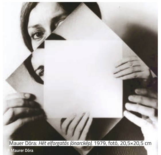
Mauer Dóra: Hét elforgatás (önarckép) , 1979, fotó, 20,5×20,5 cm Mauer Dóra