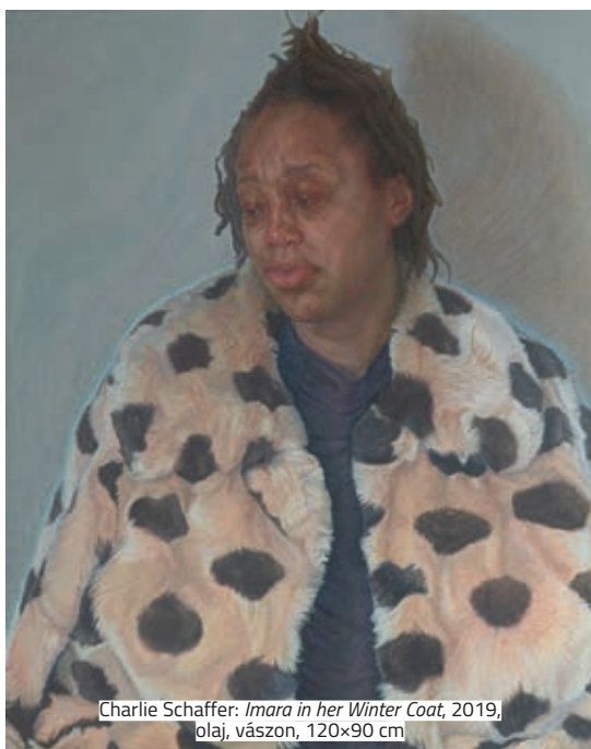
Charlie Schaffer: Imara in her Winter Coat , 2019, olaj, vászon, 120x90 cm