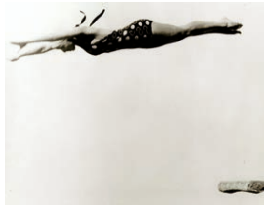
MARTIN MUNKÁCSI: Cím nélkül (Úszóruha) , évszám nélkül, ezüstszelatin-nagyítás, 27,7×35,5 cm