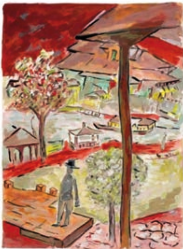
BOB DYLAN: Fisherman , 2010, giclée-nyomat, 90×71,5 cm

A kiállításon az expresszív alkotások között sorozatok is szerepelnek, amelyekben Dylan a színek, tónusok variálásával idéz fel más-más érzelmeket, hangulatot – csakúgy, mint a dalai esetében. Egy kritikában így írtak róla: „amit a színpadon tesz évek óta – a régi számainak új verzióit adja elő, hogy friss, aktuális értelmet kapjanak – most a papíron is folytatja”. A Reök-palotába összesen ötven alkotás érkezik külföldről.