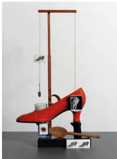
SALVADOR DALÍ: Szimbolikus működésű szkatologikus tárgy (Gala cipője) , 1931/1973, bőrcipő, fa, huzal, papír és különböző tárgyak

A művek zöme a párizsi Pompidou Központ gyűjteményéből érkezett, de a madridi Museo Thyssen-Bornemisza, a Magyar Fotográfiai Múzeum és magángyűjtemények is kölcsönöztek a tárlatnak.