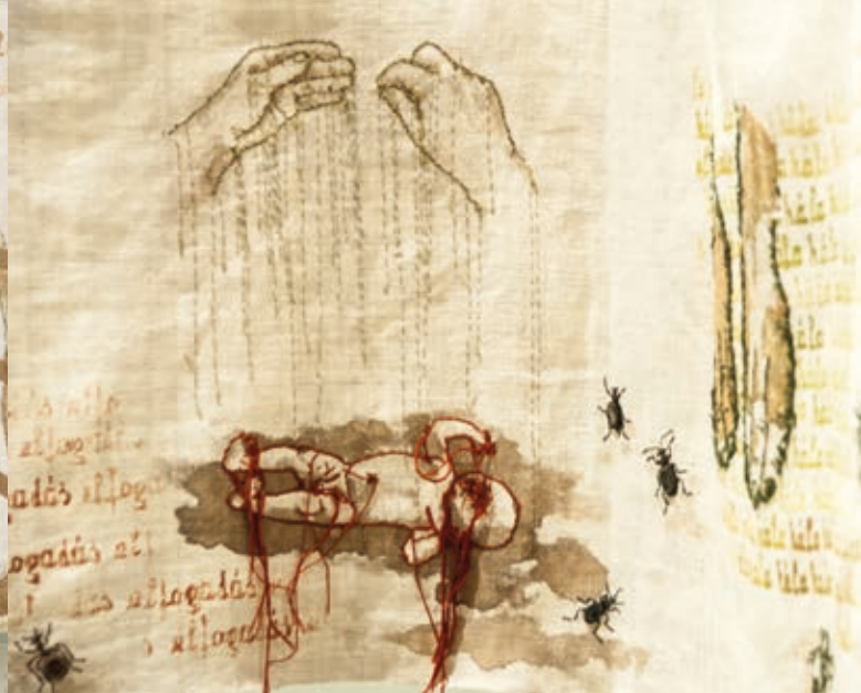
RICHTER SÁRA: Színe-visszája, 2018, hímzés, festés, applikáció, 49×1080 cm