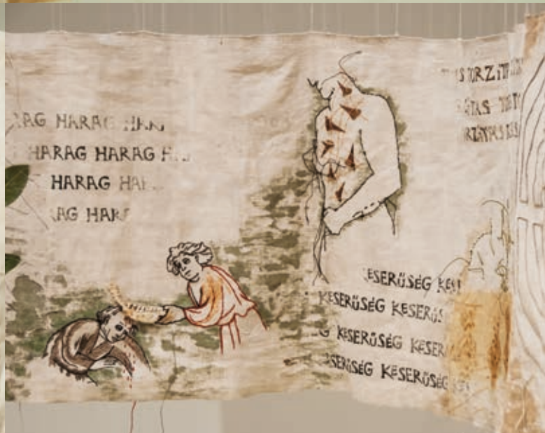
RICHTER SÁRA: Ami személyes, 2019, kiállítási installáció, hímzés, festés, applikáció, 6 db vászontekercs, összesen több mint 50×5000 cm