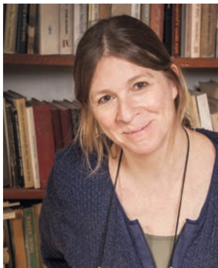
Fotó: Csontó Lajos