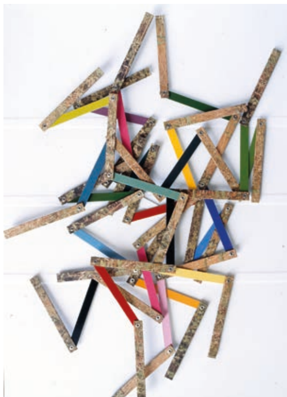
VIKTOR HULÍK: Kis függesztett geometria 1. , 1993, reliefkollázs, variálható objekt, 100×70 cm HUNGART © 2019

A 80-as évek elejétől a természetes és a mesterséges rend, a nyitott és zárt struktúrák, a sík és a tér, az állandóság és a változás, a statikus és a dinamikus integrálása foglalkoztatta. Grafikáin az élő természet képét dombornyomású, vonalas elemekkel, építészeti alaprajzokra és homlokzatokra emlékeztető geometrikus szerkezetekkel ötvözte, hogy a láthatónál árnyaltabb és igazabb valóságképet teremtsen. Más alkotásaiban a mozdulatlanak tűnő táj természetes képét az eleven