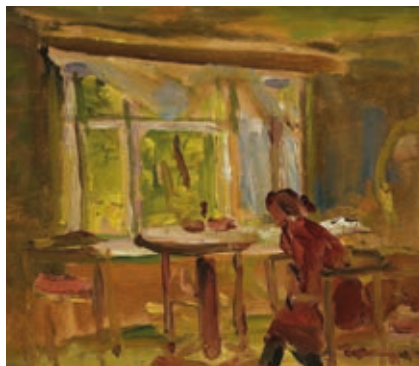
TORNYAI JÁNOS: Szobában , 1933–1934, olaj, falemez, 51,4×38,4 cm Tornyai János Múzeum

A kiállítás válogatott képanyagából egy reprezentatív katalógus is készült a kurátor, Nagy Imre szerkesztésében és bevezető tanulmányával, valamint tudományos konferencián mutatták be a Tornyai-kutatások legújabb eredményeit, melyek tanulmánykötet formájában jelennek majd meg.