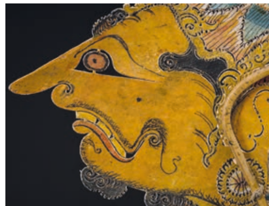
Wayang kulit purwa, istenfigura (Batara Basuki?), Zboray Ernő gyűjteményéből, 19. század második fele, festett bőr, szaru

A kiállítás – az időszaki cserékkel együtt – több mint ötszáz műtárgyat vonultat fel, s a markánsabb múzeumtörténeti periódusok mentén vizsgálja a különböző korszakok, lehetőségek és gyűjteményezési szempontok alapján létrejött tárgyanyag legrepresentatívabb darabjait és tárgycsoportjait. A Made in Asia kiállításban a múzeum minden gyűjteményét felvonulathatja, így a kínai, a japán, a koreai, az indiai, a délkelet-ázsiai, a mongol, a tibeti-nepáli, a közel-keleti és a Zichy-féle régészeti gyűjteményt is.