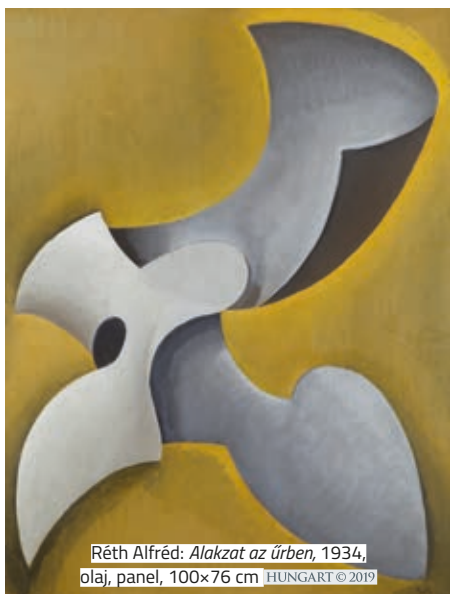
Réth Alfréd: Alakzat az űrben , 1934, olaj, panel, 100×76 cm HUNGART © 2019