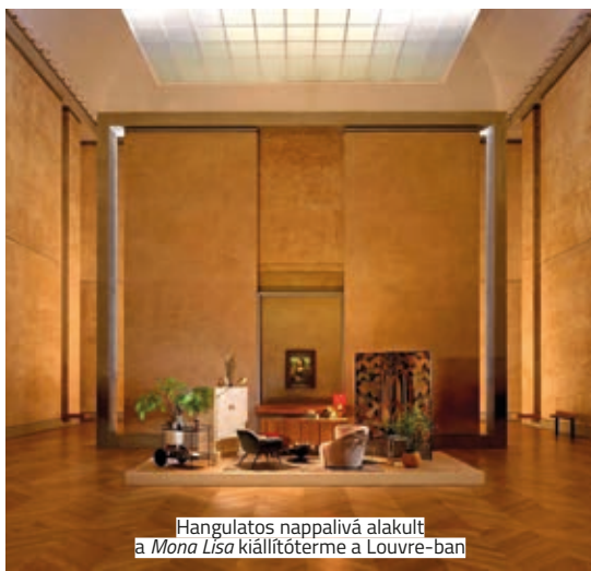
Hangulatos nappalivá alakult a Mona Lisa kiállítóterme a Louvre-ban