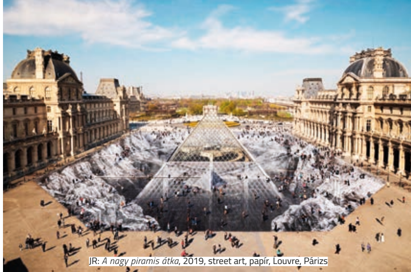
JR: A nagy piramis átka , 2019, street art, papír, Louvre, Párizs