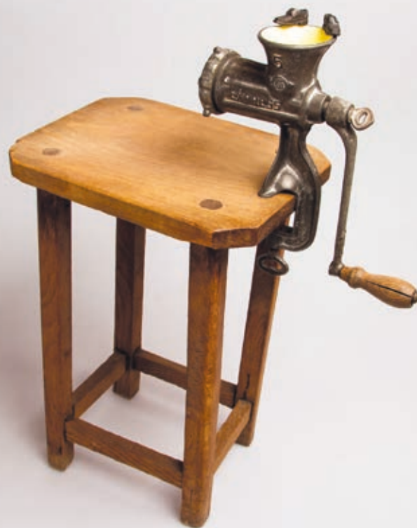
SOMOGYI EMESE: Utás és holdvilág , 2015, vegyes technika, 65×45×26 cm

Góra kitartóan keresi azokat a festői megoldásokat, melyekkel felmutathatná, érzékeltethetné mindezt. Legújabb sorozata, a