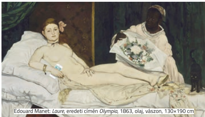
Edouard Manet: Laure , eredeti címén Olympia , 1863, olaj, vászon, 130x190 cm

A párizsi múzeum partnerével, az Airbnb-vel közösen pályázatot hirdetett, amelynek nyertesei, egy pár, április 30-án egy estét és egy éjszakát az épületben tölthettek, kizárólag ketten. Egy éjszaka csak az övék volt Mona Lisa , exkluzív vacsorát költöttek el a Milói Vénusz mellett megterített asztalnál, majd egy privát akusztikus koncerten vehettek részt III. Napóleon rokokó szalonjában, az este zárásaképpen pedig a Louvre modern szimfóniája, a Pei-piramis üvegteteje alatt hajthatták álomra fejüket. Ki ne irigykedne rájuk?