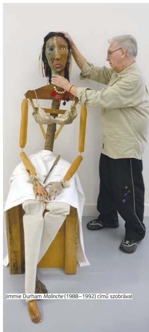
Jimmie Durham Malinche (1988–1992) című szobrával