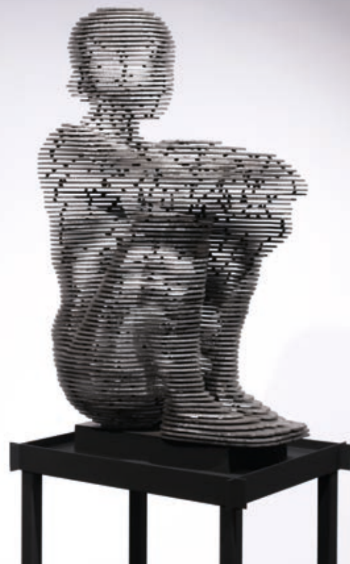
MAJOROS ÁRON ZSOLT: Korlát , 2017, inox, 80×45×35 cm

A test ábrázolása a korszak embereszményének metaforája. Az emberábrázolások története nem más, mint a testábrázolások sorozata. Ahogy Hans Belting írja: „Az ember olyan, ahogyan a testben megjelenik. A test maga is egy kép, még mielőtt újraalkotnák a képben. [...] Az ember-test-kép háromszög nem oldható fel, ha csak nem akarjuk elveszíteni mindhárom vonatkoztatási pontot.” 1