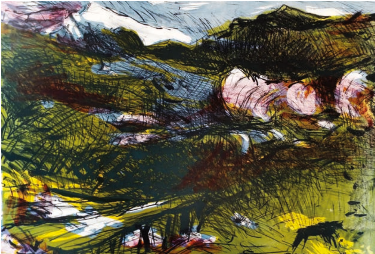
VILHELM KÁROLY: Nagy tiroli táj , 1991, litográfia 70×100 cm

egészen friss szerzemények, mint Lévai Ádám 2015-ös tusrajza, ám többségük az ezredfordulón készült nyomat.