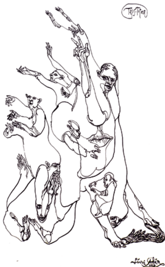
LÉVAI ÁDÁM: Taps – totem , 2015, tusrajz, 30×45 cm

A grafikai gyűjtemény első nagyobb szabású bemutatójára 2008-ban került sor a Szolnoki Galériában, azóta több alkalommal volt látható belőle válogatás. 2 Legutóbb 2018-ban a nagy méretű, reprezentatív nyomatokból láthatott tárlatot a közönség. Ezúttal olyan lapokat mutat be a Szent József Ház kiállítóterme, amelyek csak ritkán vagy még soha nem szerepeltek az alapítvány kiállításain. Technikailag a képgrafika valamennyi tradicionális formája megjelenik itt az egyedi rajztól, a színes fametszettől és linómetszettől a mives akvatintán, litográfián át a mediálisan transzparens szitanyomatig. A bemutatott művek közül a legkorábbiak a 60-as évekre datálódhatnak (Dús László és Kovács Imre munkái), akadnak benne