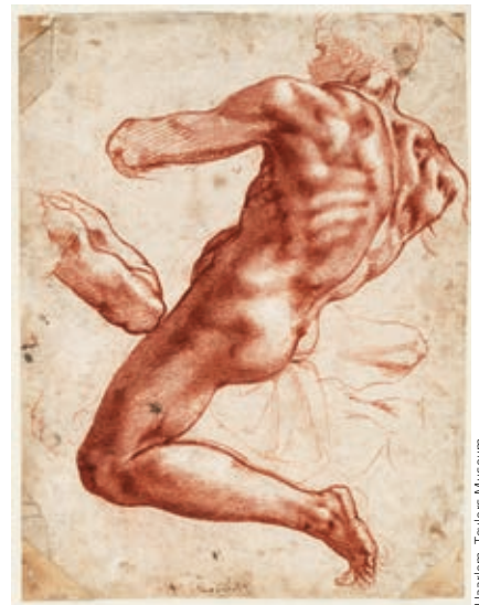
MICHELANGELO BUONARROTI: Akttanulmány , 1511 körül, vörös kréta, fedőfehér, 279×214 mm

A tárlat fókuszában a mester 29 alaktanulmánya áll az első ötleteit megőrző, gyorsan papírra vetett skiccektől a művek kivitelezését közvetlenül megelőző, aprólékosabban kidolgozott, befejezett rajzokig. A kiállításon a látogató a mester hírnevét megalapozó legendás műveihez – mások mellett a Sixtus-kápolna mennyezetképeihez, a Medici-síremlékekhez, az elveszett Lédához és az Utolsó ítélethez – készült rajzain keresztül képet alkothat Michelangelo kiapadhatatlan alkotóerejéről és páratlan géniuszáról.