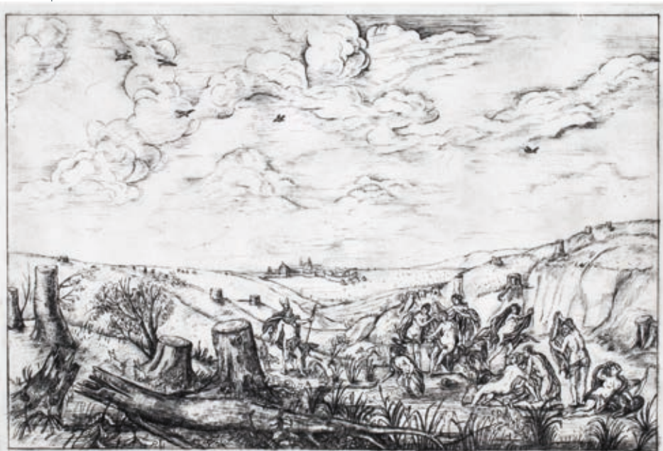
GOSZTOLA KITTI: Aktaión és Artemisz , 2019, heliogravűr, 26×38 cm

G. K.: Ha magunkat is természetnek tekintjük, akkor „a mítosz az emberi létezésnek bizonyos fajta metafizikai értékesítése”. E közös természeti létben