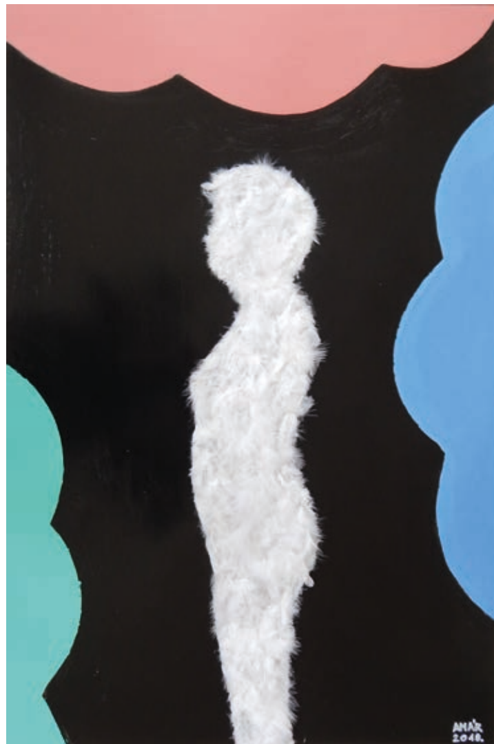
VARGA-AMÁR LÁSZLÓ: Tollas akt , 2019, ipari festék, madártoll, 90×70 cm

A 2000-es évek közepére a ciklusnyi fejvariáció elmozdul az absztrakció felé, egységes, letisztult egészé válik. Azóta főleg térfestményeket komponál. Itt érhetjük tetten, amit Hegel az Estztétika című művében leírt: „A festészet a legbensőbbet is külső alakkal fejezi ki, nem nélkülözheti a plaszticitást!” Ezek a plasztikai elemek felhasználásával megalkotott képek egyenes folytatásai festészeti törekvéseinek. 2009-től Átvilágítás címmel politikai és erkölcsi üzenetet hordozó sorozatot kezdett, amelyben saját testéről készült röntgenleleteit applikálta képeibe. Ezzel párhuzamosan közel negyedszázaddal korábban készült képeit festette át, új attribútumokkal gazdagítva azokat ( Retro-sorozat ), 2016-tól pedig geometrikus motívumok kerültek a vásznakra.