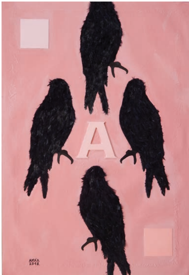
VARGA-AMÁR LÁSZLÓ: A négy fekete madár , 2018, ipari festék, madártoll, 120×90 cm

egymást a női figurák. 2002-től új sorozatot kezdett. Egy önarcképszerű fej tölti ki az egész képmézőt a nagy méretű, többnyire 200×150 cm formátumú képeken. A kisebbeken a fejet röntgenfilmmel, illetve celofánnal töltötte ki. Majd a fejek sorokká, hullámokká rendeződtek, egymás alá süllyedtek, átlukadtak, dinamikus mozogtak.