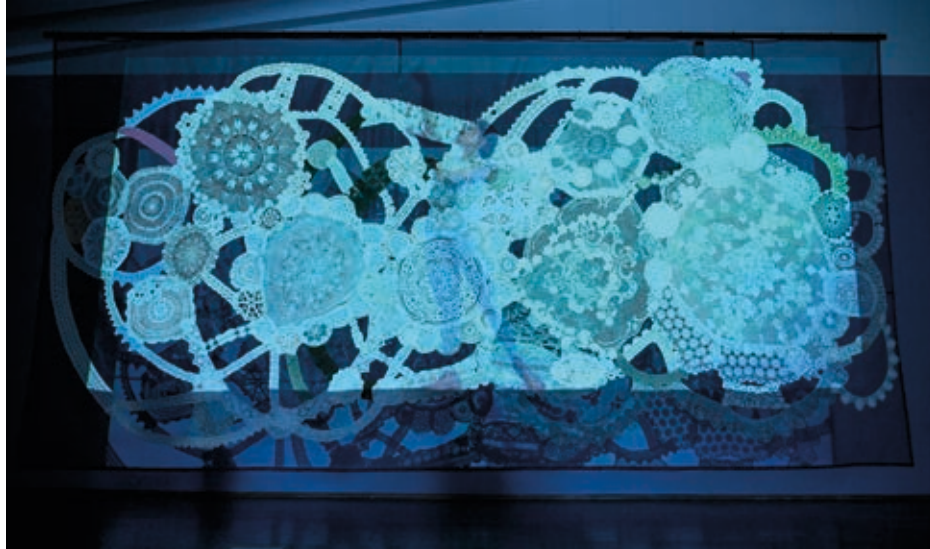
EVA PETRIČ: Az asztrocita kert látogatója , 2019, multimédia-installáció