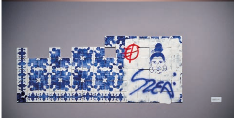
SZABÓ ESZTER ÁGNES: Kontextuskapcsoló , 2019, kerámia, stencil, spray, 15×15 cm