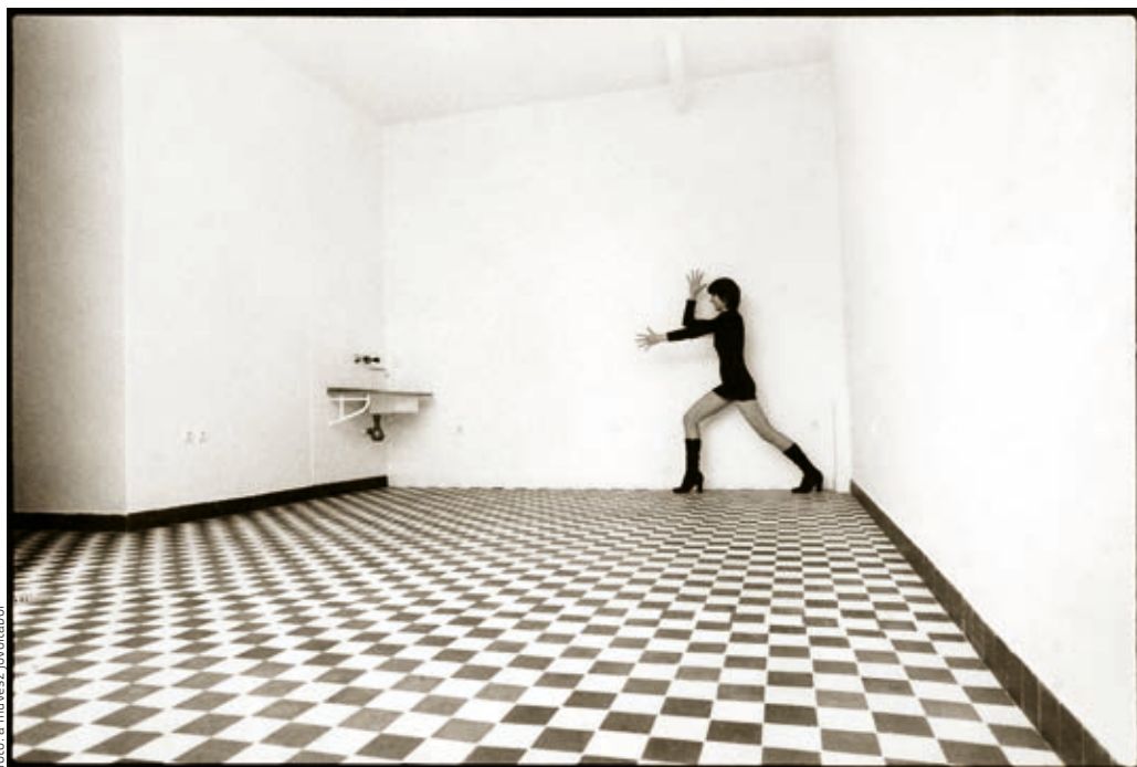
VÉCSY ATTILA: HECI , 1977, matt karton, bromofort papír, 18×24 cm