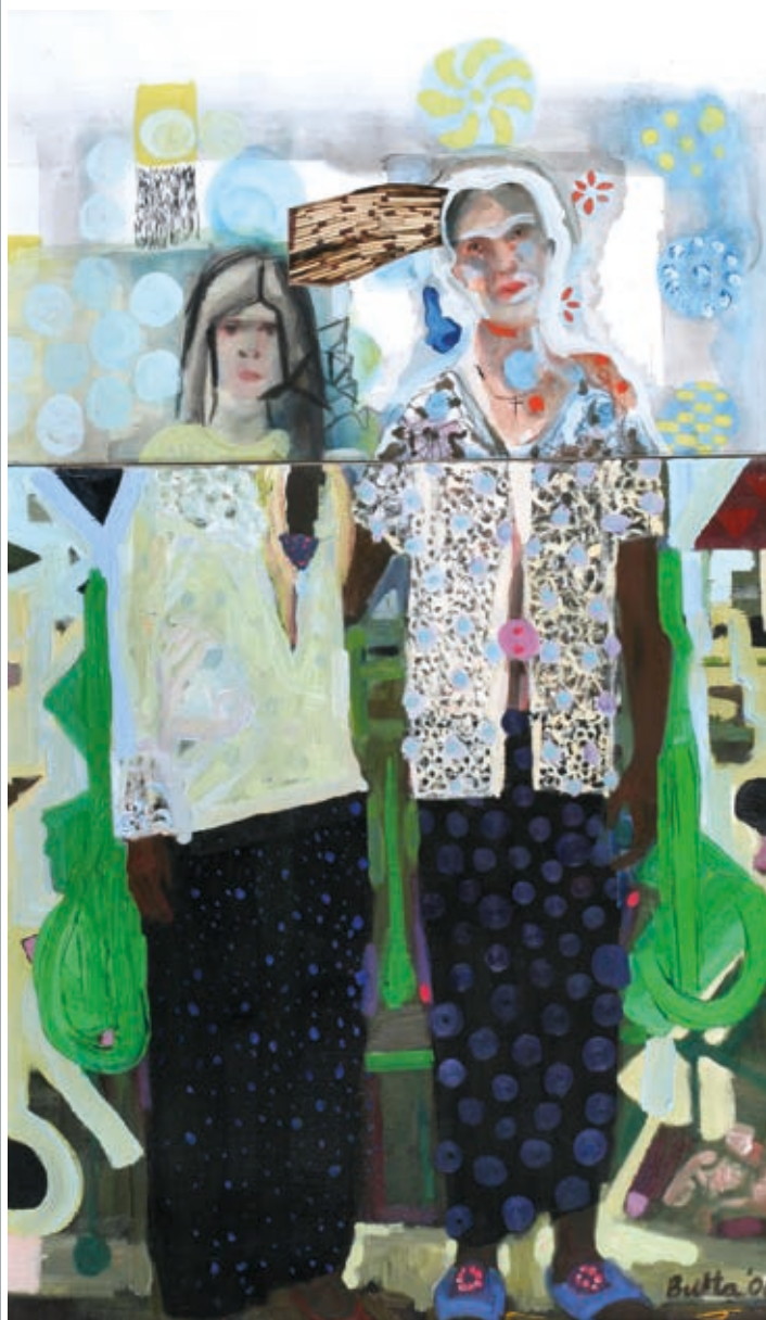
BUKTA IMRE: Nővérek , 2006, vegyes technika, vászon, papír, 85×50 cm, HUNGART © 2019

Vízivárosi Galéria, 2019. IV. 3–27., FUGA, Trezor, 2019. IV. 10–29.