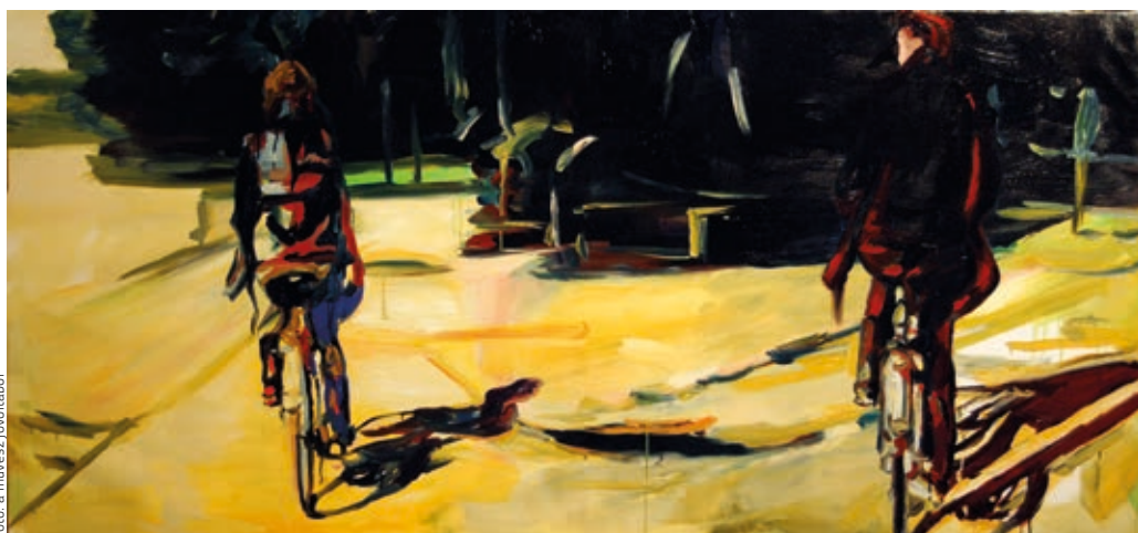
TÓTH ANGELIKA: Folyó és álom 1. , 2010, olaj, vászon, 92×200 cm