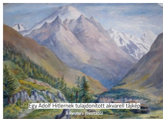
Egy Adolf Hitlernek tulajdonított akvarell tájkép