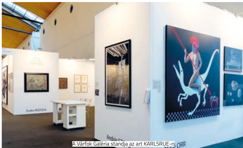
A Várfok Galéria standja az art KARLSRUHE-n

Forgács Péter munkája tavaly novemberben a LOOP Barcelona videófesztiválon kapta meg a fődíjat, idén pedig Haász István munkáit válogatták be a madridi Galeria Odalys Universo Madí című csoportos tárlatára. A mintegy 50 művész alkotásait felvonultató, február 23-án megnyílt nemzetközi kiállítás a kortárs absztrakt geometrikus művészet meghatározó irányzata, a Madímozgalom koncepcióját és jelenét mutatja be.