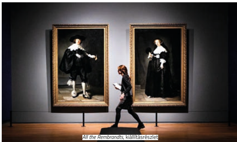
All the Rembrandts , kiállításrészlet