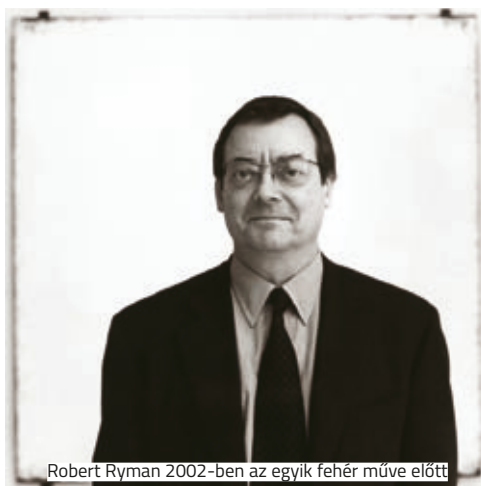
Robert Ryman 2002-ben az egyik fehér műve előtt

Robert Ryman (1930–2019) sosem hagyta magát bekegerezni. Elsősorban realistának tartotta magát, és azt vallotta, hogy a festészetben semmi sem hitelesebb, mint a felület, a rákent festék és az egész megvilágító fény. Éppen ezért használt csak fehér munkája során. Számára a festmény fizikai valójában rejtett a lényeg. Leginkább négyzet alakú vászonra dolgozott, nem adott címet a műveinek, és akkurátusan figyelt a kiállított alkotások megvilágítására, ugyanis állította, hogy művei csupán a falon nyerne értelmet, onnan levéve őket megszűnik a létjogosultságuk.