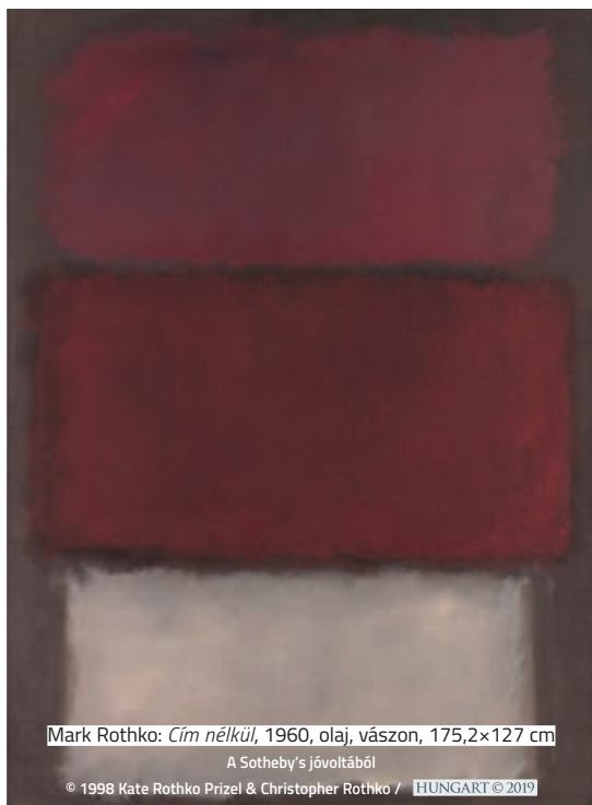
Mark Rothko: Cím nélkül , 1960, olaj, vászon, 175,2×127 cm

A San Francisco Museum of Modern Art a Sotheby's árverésén kínálja eladásra egyik legértékesebb festményét, Mark Rothko 1960-as művét ( Cím nélkül ), amelynek értékét 35 és 50 millió dollár közé becsülik. Az eladásból befolyt összegből a San Franciscó-i múzeum több női és színes bőrű művész alkotásaival szeretné feltölteni a gyűjteményét, ellensúlyozva a fehér férfi művészek túlreprezentáltságát a kiállítóhelyen.