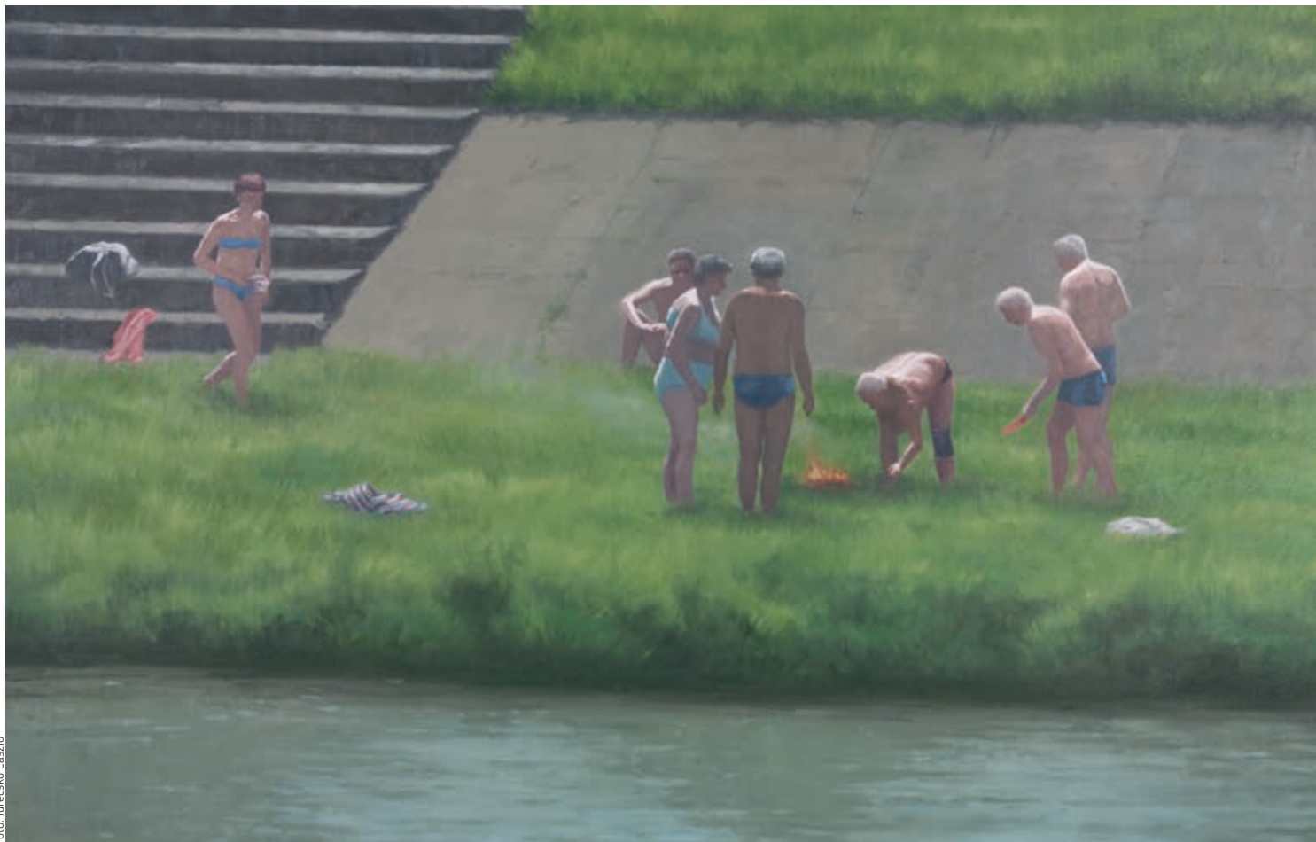
ŠERBAN SAVU: Hétféle 2. , 2007, olaj, vászon 64×100 cm, HUNGART © 2019

a holokauszt előérzeteként értelmezhető Bokszolói felé mutatna: az áldozat és a téboly kozmikus méreteket öltenek.