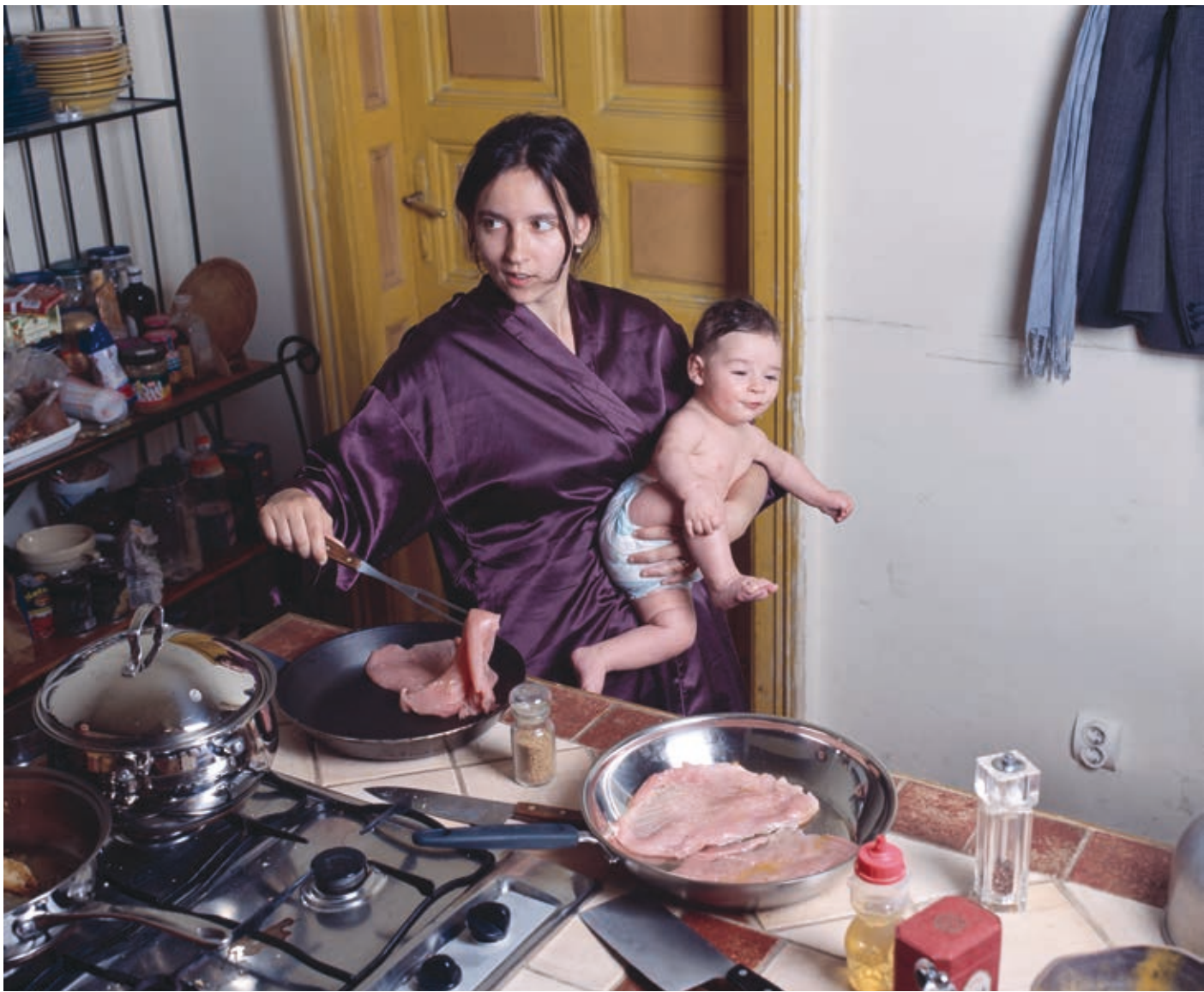
FABRICIUS ANNA: Eszterke, Háztartási anyatigris-sorozat, 2006, alumíniumra kasírozott lambda print, 80×100 cm

a műtéti beavatkozás vagy a mesterséges megtermékenyítés különösen. Ezt a mások által gondosan titkolt eseményt Fajgerné Dudás Andrea a festménye témájává teszi, s a beavatkozást végző orvost isteni hatalommal ruházza fel ( Angyali üdvözet ). A megfogant, majd megszületett gyermek további képeinek válik inspirációjául.