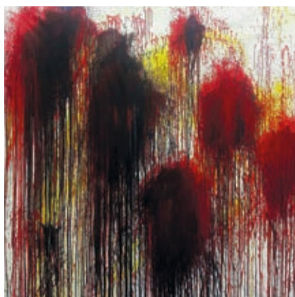
BÁNKI ÁKOS: Lélekvirágok , 2018, a sorozat egy darabja, akril, vászon, 200x190 cm

Bánki háromhetes intenzív munkasorán, a Miskolci Galéria műteremprogramjának keretében hozta létre azt a sorozatot, amelyet Lélekvirágok címmel a Miskolci Galériában állít ki.