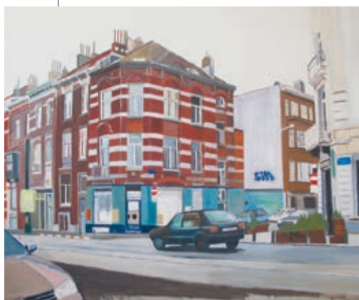
KIM CORBISIER: Cím nélkül , 2008 körül, olaj, vászon, 100×120 cm

Corbisier saját fotók alapján festette és rajzolta élettereit, Brüsszelt és Párizst. Felismerhetjük az anderlehti vöröstéglás házat, a buszt száma szerint, a reptérre vivő járatot és így tovább. Ugyanakkor – bár a miénktől távoli közegben készültek – a képek a mi számunkra is hoznak valamiféle ismerősség-, otthonosságérzetet. A kamerát fókuszáló, a pillanatot éppen akkor és ott elkattintó érzékenység, a megfigyelő miénket irányító tekintete helyez el bennünket a pillanatban, vagy inkább az ahhoz való viszonyban. Az egyszerre több világban való lét otthonossága, csakúgy mint a több világba tartozás bizonytalansága, Corbisier számára az életútjából fakadó evidencia volt.