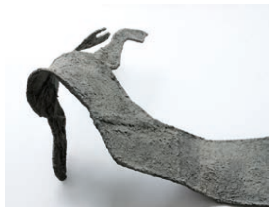
NÉMETH ÁGNES: Eleven árnyék , 2018–2019, gömbacél, juta, színes föld