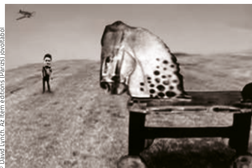
DAVID LYNCH: Small Stories: Thinking of Childhood

A Budapest Fotófesztivál igazi különlegességgel nyitotta meg 2019-es rendezvénysorozatát február 28-án a Múcsarnokban. A harmadik éve megrendezésre kerülő fesztivál nyitókiállítását David Lynch, az amerikai függetlenfilm élő legendája, rendező, forgatókönyvíró, festő és zenész jegyzi Small Stories (Kis történetek) című tárlatával. Lynch egész munkásságára nagy hatással bírt a szürrealizmus, az ezotéria, a szorongás és az erőszak művészi és populáris megjelenítésének speciálisan amerikai tradíciója. Lynch szürreális képeinek alapja a fotomontázs, a portrék és a reprodukciók újraértelmezése. Ezekből térbeli-időbeli dimenziók születnek, melyek egy olyan univerzummá állnak össze, amelyet a mester filmjeiből már jól ismerünk. A Small Stories egy valóságon túli pszichedelikus utazás az érzelem, a humor, a játékosság és a nyugtalanság világában. Filmes munkáihoz hasonlóan képein az álom dominál, poétikájának alapvető ereje a tudattalan és a valóság közötti összefonódás. David Lynch kiállítása a párizsi Maison Européenne de la Photographie és a párizsi Item gallery közös szervezésében valósult meg.