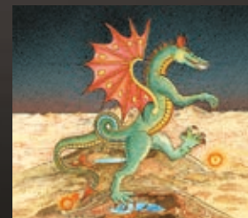
A FÉNY-SÁRKÁNY NAPJA. 2003 papír, tus, toll, színes ceruza, akvarell, szórópisztoly (részlet)

A HUNGART 2009 óta jelenteti meg kismonográfia-sorozatát, amely kortárs képző-, ipar- és fotóművészek munkásságát dolgozza fel. A HUNGART-könyvsorozat hiánypótló a vizuális művészeti szakmában és a hazai művészeti könyvpiacra. A könyvsorozat hozzájárul a jelenkori magyar művészet dokumentálásához, szellemi értékeinek megőrzéséhez, valamint hazai és nemzetközi megismertetéséhez.