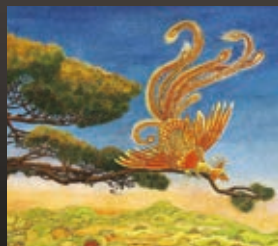
AZ ARANYMADÁR NÉPMESE. 2007 vászonpapír, olaj (részlet)