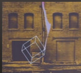
ÉLÉRE ÁLLÓ KOCKA. 1980 papír, szítanyomat (részlet)