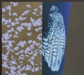
HASADÉK. 1983 papír, szítanyomat (részlet)