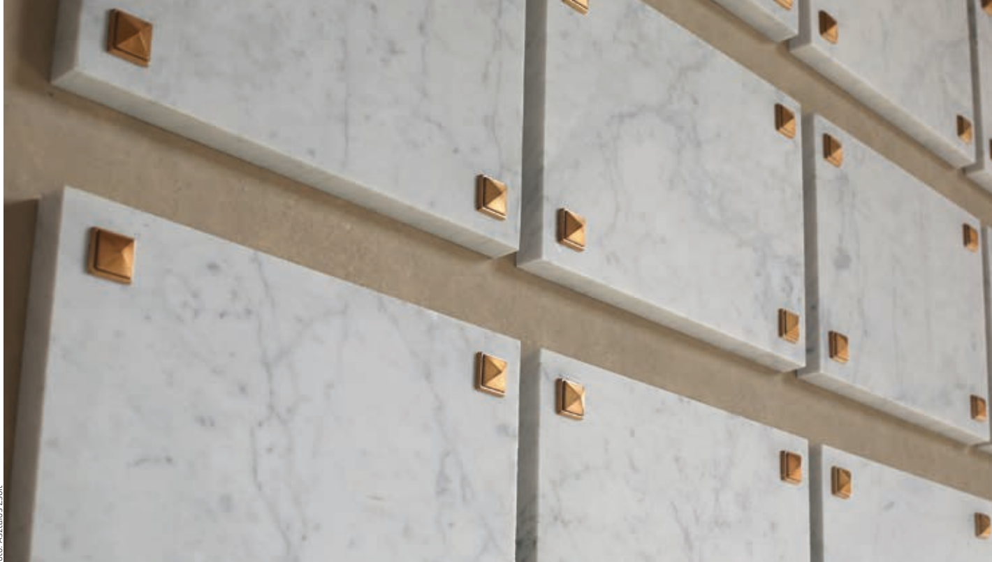
ASZTALOS ZSOLT: Eltűnt emlékeknek, 2018