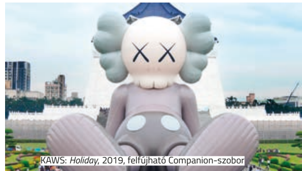
KAWS: Holiday , 2019, felfújható Companion-szobor

Brian Donnelly, művész-nevén KAWS, egy hatalmas felfújható szoborral tette emlékeztetéssé saját kiállítását az ázsiai szigetország fővárosában. 33 méteres magasságával ez eddig a művész legnagyobb alkotása, amely ülő pozícióban ábrázolja KAWS legismertebb figuráját, Companiont. A látványos művet Tajpejben a Csang Kaj-sek-emlékszarnok előtt állították fel, hogy már messziről odavonzza a látogatókat a Holiday című tárlatra és vásárra.