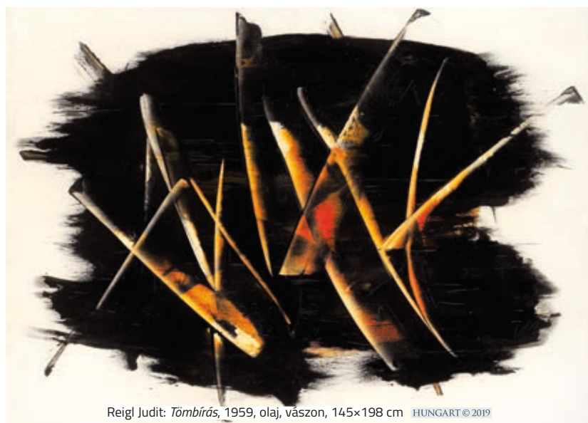
Reigl Judit: Tömbírás , 1959, olaj, vászon, 145×198 cm HUNGART © 2019

A galéria idén már a 11. alkalommal vett részt a brüsszeli BRAFA Művészeti Vásáron, amely az év első igazán jelentős eseménye és a kortárs galériák egyik legnagyobb találkozóhelye. Január 26. és február 3. között Reigl Judit, valamint Ilhwa Kim és Lim Dong Lak koreai művészek alkotásait állították ki a szinte mindig zsúfolásig megtelt standjukon.