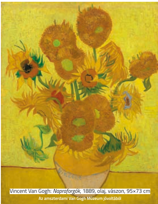
Vincent Van Gogh: Napraforgók , 1889, olaj, vászon, 95×73 cm Az amszterdami Van Gogh Múzeum jóvoltából