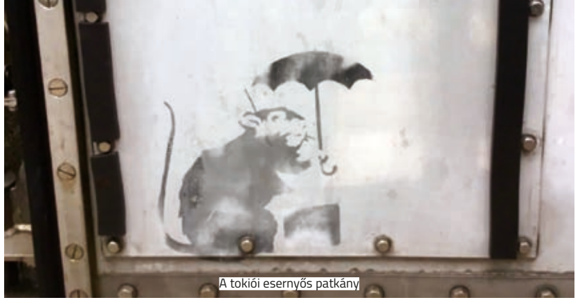
A tokiói esernyős patkány

kutatói most úgy döntöttek, hogy leveszik a falról a világszerte ismert remekművet, hogy ne veszítsék el vibráló árnyalatukat a festmény azon részei, ahol megtalálható a sárga pigment. A restauráció mintegy 6–8 hetet vesz igénybe, hogy azt követően még hosszú évekig eredeti fényükben tündökölhessenek a sárga napraforgók.