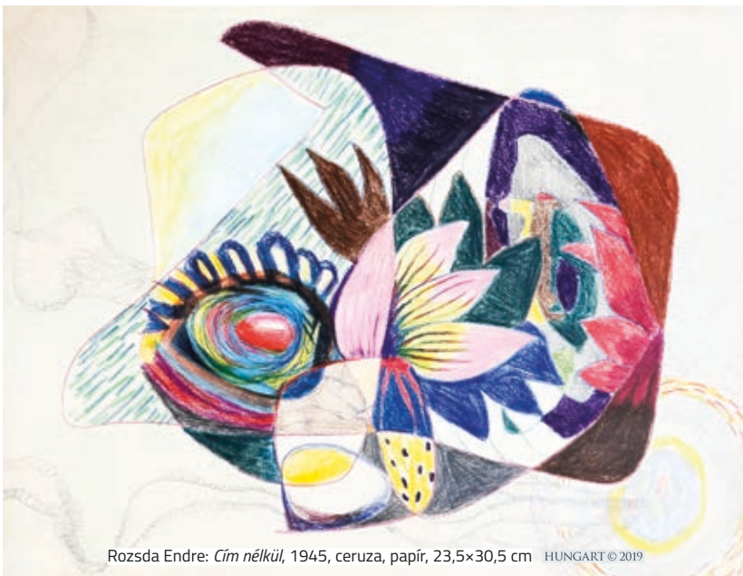
Rozsda Endre: Cím nélkül , 1945, ceruza, papír, 23,5×30,5 cm HUNGART © 2019