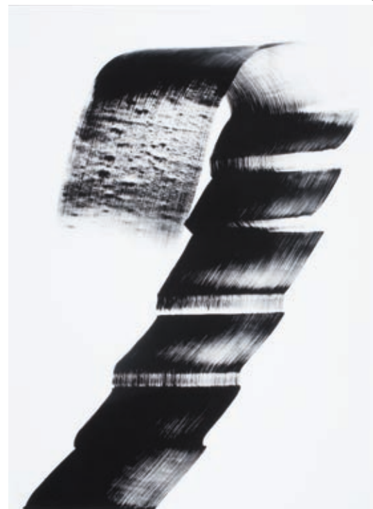
NÁDLER ISTVÁN: Gesztus , 2009, giclée-nyomat, 93x68 cm HUNGART © 2019

ismertebbé váló klasszikus archív gyűjteményhez, a Schola Graphidis Budensis anyagához társítsa, kortárs gyűjteményként. Egyes alkotók növendékként és érett művészként készített munkái kerüljenek ezzel egymás mellé.