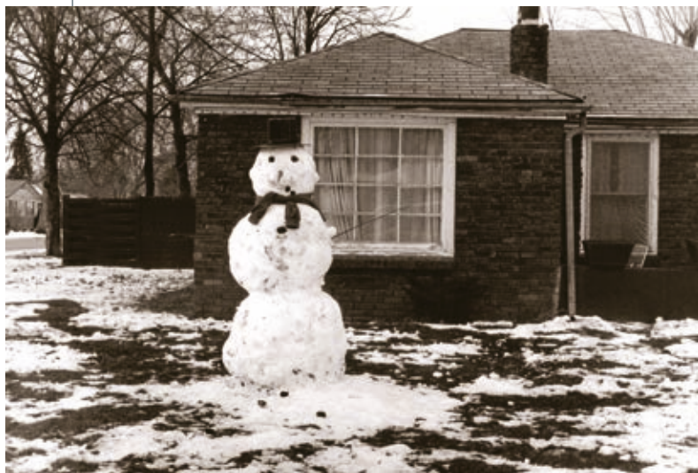
DAVID LYNCH: Hóember 14 , 1993, archív ezüstszelatin-nyomat

Mintha minden gondolatát megfontolás nélkül kimondatná szereplőivel. Az önelemzést azzal fokozza, hogy a fülsértő, monoton hangon kántáló, süket öregurat, Gordon Cole-t saját maga alakítja, és így, mint a Shakespeare-drámák narrátora, megvilágítja a történeteket, de felteszi a nézőktől elvárt kérdéseket is. A választ azonban nekünk kell összerakni, több részből és a jelek kibontása által. Beszéd közben, Cole szerepében kellemetlenül hosszú szüneteket tart Lynch, már-már felállnánk, de ekkor elejt egy fanyar tréfát, vagy bedob egy újabb rejtélyes szálát.