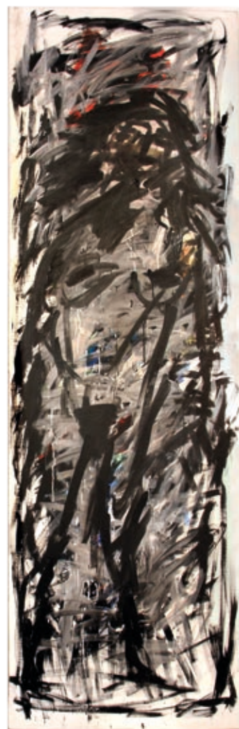
HEGYESHALMI LÁSZLÓ: Egy férfi – Egy nő , 1984, akril, vászon, 250×80 cm

fognak körül egy négyzetes teret. A zártság és a nyitottság jelképe ez, ahonnan nem lehet elmenekülni. Foglyai vagyunk a mágikus, megfjejt-hetetlen neveknek.