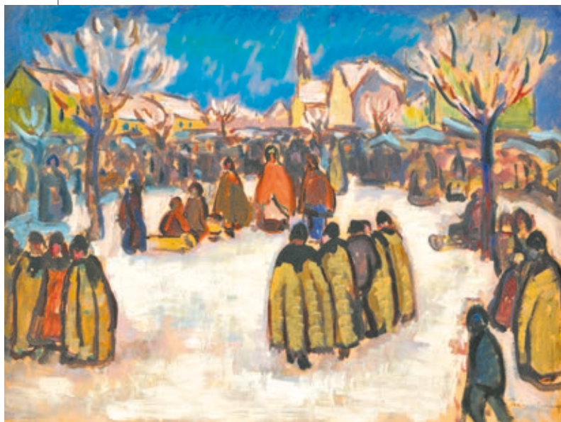
IVÁNYI GRÜNWARD BÉLA: Piac a kecskeméti hóban , olaj, karton, 50×67 cm Magángyűjtemény, a Virág Judit Galéria közvetítésével

A városi tanács egyhangú lelkesedéssel támogatta az „új művészthon alapítását”, és a Műkertben tíz műtermes bérházat, valamint hat villát építtetett Jánszky Béla és