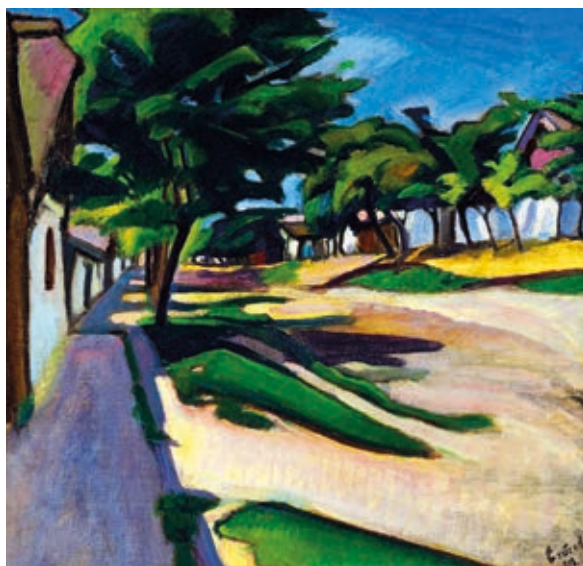
ERŐS ANDOR: Kecskeméti utca , 1913, olaj, fa, 43×45 cm

A kiállítás a művésztelep alapítását követő évtizedes fénykorra, az 1909 és 1919 közötti időszakra koncentrál. A 20. századi modern magyar művészet e jelentős művészkolóniája is kerek évfordulót, születésének 110. jubileumát ünnepli hamarosan. A művészet-történeti utókor értékelésében a századforduló