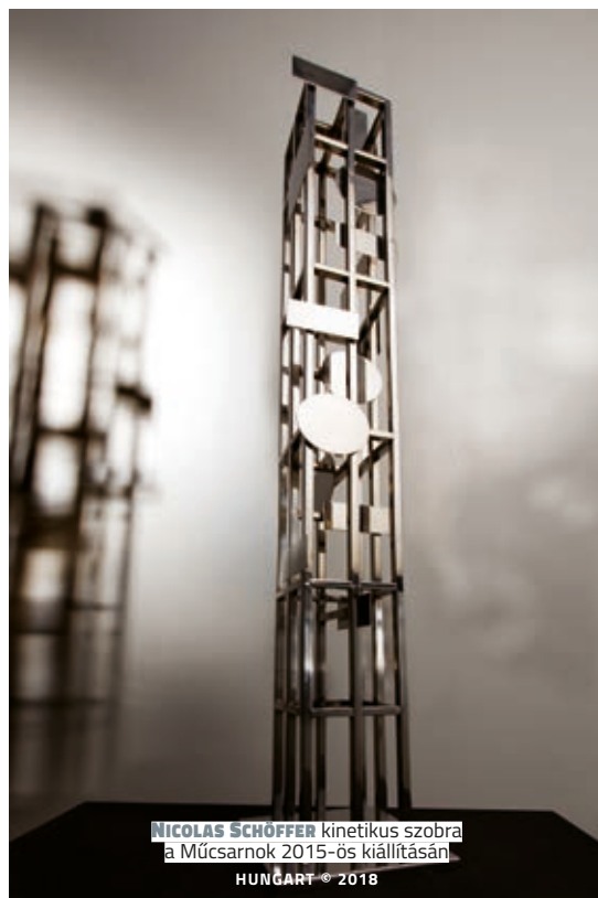
NICOLAS SCHÖFFER kinetikus szobra a Múcsarnok 2015-ös kiállításán

November 20. óta a Római Magyar Akadémia Galériájában (Falconieri Palota) látogatható Nicolas Schöffer (1912–1992) Luce in movimento (Mozgó fény) című kiállítása. A tárlat Schöffer közel 40 művét (tus, ceruza, nyomat, kollázs, akril, installáció, szobor) tárja a közönség elé. 1968-ban mozgó szobraiért Schöffer kapta meg a Velencei Biennálé nagydíját, a következő évben pedig az ő műveivel nyitotta meg kapuit a híres római Studio Farnese. 1980-ban Kálocsán, egykori szülőházában nyílt meg a Schöffer Múzeum, amelynek gazdag anyagát a művész adományozta szülővárosának. Nicholas Schöffer 1992. január 8-án hunyt el Párizsban. Alkotásai megtalálhatók Európa és Amerika számos nagyvárosában.