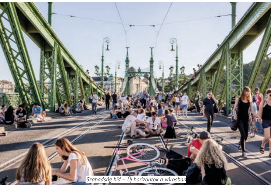
Szabadság híd – Új horizontok a városban