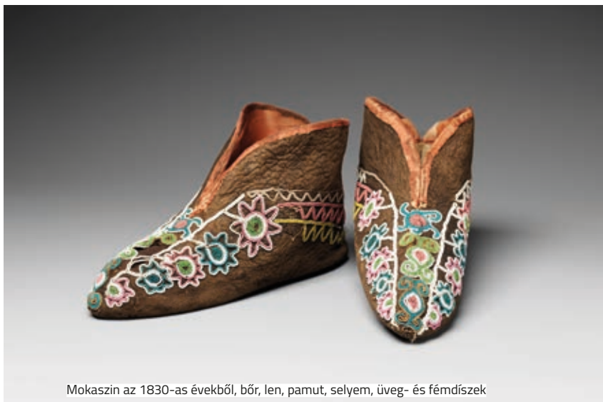
Mokaszin az 1830-as évekből, bőr, len, pamut, selyem, üveg- és fémdíszek