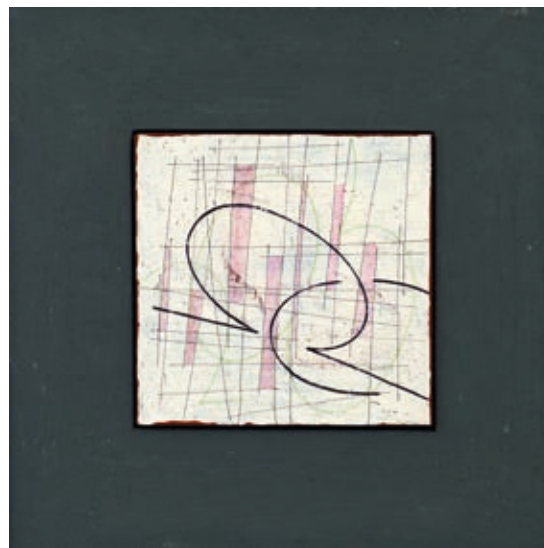
MATZON ÁKOS: Fej vagy vitorla, vázlat , 2016, akril, vászon, 50×50 cm

Malevics, Liszickij, Strzeminski, Kassák és a többiek vagy egy új, a bűnöktől, szenvedésektől megszabadult világ utópikus alapelemeit fektették le, vagy a maguk egyszerű, de annál elementárisabb eszközeivel az emberi létezés végső kérdéseire kerestek választ. De azzal is tisztában volt, hogy ezeket a nemzetközi avantgárd mozgalom kollektív hite, az őket mozgató, vajdó társadalmi folyamatok hiányában nem lehet egyszerűen újra megeleveníteni, nem léphetünk kétszer ugyanabba a folyóba. Kurrens, élő mozgalom, a kollektív