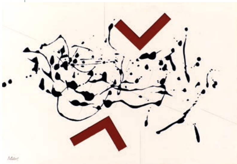
MATZON ÁKOS: Jelek között 1. , 2001, relief, akril, karton, 37×53 cm

Így tesz abban a sorozatában is, mely a francia filozófus-teológus, Teilhard de Chardin nyomán az Úton az Ómega felé címet viseli. Részben formailag, de intencionálisan is megidézi a nagy elődök, Mondrian, Doesburg, Rodcsenko kísérletét a végtelen, a világban rejlő transzcendencia megragadására, de mindezt magánya, individualitása korlátozottságának tudatában. Mindenesre megkísérli az univerzális és alapvetően optimista teilhard-i gondolat, az emberi szellemnek egy végső, transzcendens, krisztusi pontba való