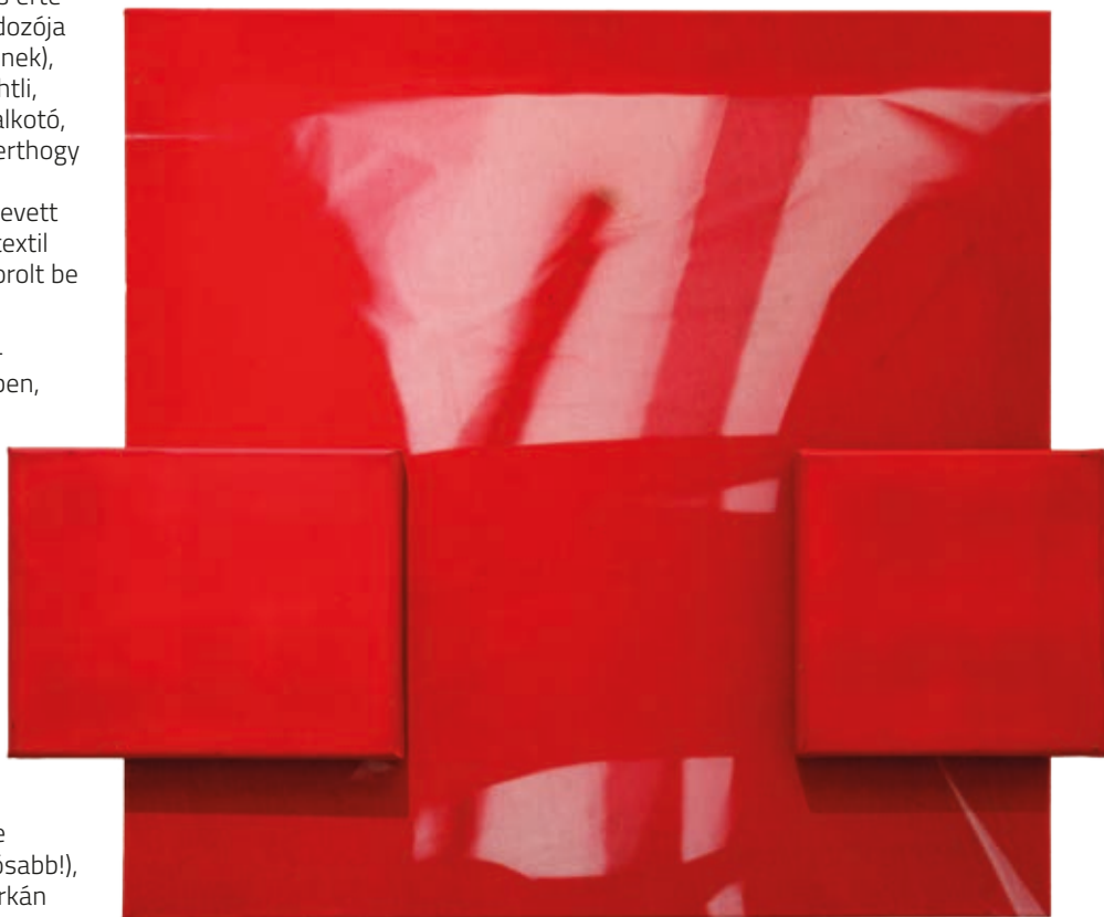
POLGÁR CSABA: Vörös Rébék , 2008, textil, fénynyomat, 60×70 cm HUNGART © 2018