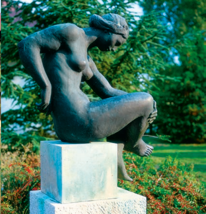
CYRÁNSKI MÁRIA: Merengő , 1986, bronz, 180 cm, Ercsi, Esze Tamás utca, Egészségügyi Központ

Dunaújvárosban sem egyedüli köztéri műveként áll ez a klasszikus eszmények által áthatott női akt. Még a pályakezdés alkotóperiódusában, 1973-ban a művész legnagyobb vállalkozásának minősítette Végvári Lajos a Giuseppe Tomasi di Lampedusa A párdúc című novellája igézetében született Sellő című alkotást, amely bronzba öntve 1978-ban kútszoborként került a Sportuszoda előtti térre. E korai művét is jellemzik Végvári Lajos a művész alkotásairól megfogalmazott megállapításai: „Az érzelmek, álmok, képzelgések világát járja be munkáiban. Bár mesterségbeli ismeretei jók, nem a megvalósítás pontosságát adja igazi értékeit, hanem az érzelmi fűtöttség, a témával való személyes azonosulás, sorsok vállalása és átélése. Indulatból mintáz: érzelmeinek lenyomatát akarja megörökíteni gazdag, részletezett formákkal és mozgalmas felületekkel.” 3 A programadó Hajnal mellett a Sellő (Lighea) is expresszív megformálású alkotásnak ítéltető, amelyen a realista megvalósítással ellentétben a lendületes figuraalakítás által elnagyolt, megnyújtott, kissé torzított formarend uralja a kompozíciót.