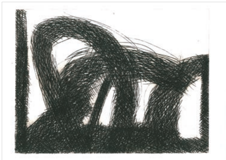
BUTAK ANDRÁS: Karcolt vonalak B , 2018, hidegtű, 240×320 mm