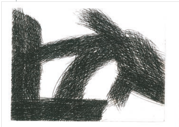
BUTAK ANDRÁS: Karcolt vonalak A , 2018, hidegtű, 240×320 mm

hordozót talált, egyfajta kemény műanyag lapot. Ennek az az előnye, hogy viszonylag könnyen megmunkálható, mélyen lehet bele karcolni, ezáltal a festékréteg szinte plasztikusan emelkedik ki a papírról. A hátránya – ha ezt egyáltalán annak lehet nevezni – csupán annyi, hogy a vonalak széle kevésbé lesz szálkás, a lenyomatott felület ellenben markánsabb, hangsúlyosabb a rézlemezrel készült munkákénál. Az Art9 Galériában szereplő több mint huszonöt nyomat meggyőzően bizonyítja Butak András grafikai munkásságának sokszínűségét.