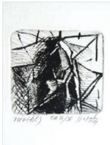
BUTAK ANDRÁS: Váz , 1994, hidegtű, 60×60 mm

Butak András a 90-es évek elejétől készíti elvont tájakat és növényi struktúrákat megőrkítő nyomatait. A hidegtűhöz való vonzódását jól jelzi, hogy 1995 óta rendszeresen szerepel az užicei Nemzetközi Hidegtű Biennálén. Kezdetben kisebb méretű rézlemezre karcolta elvont tájait, majd alumíniumlemezzel kísérletezett, végül 2003 körül sajátos