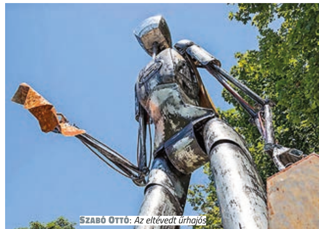
SZABÓ OTTÓ: Az eltévedt úrhajós