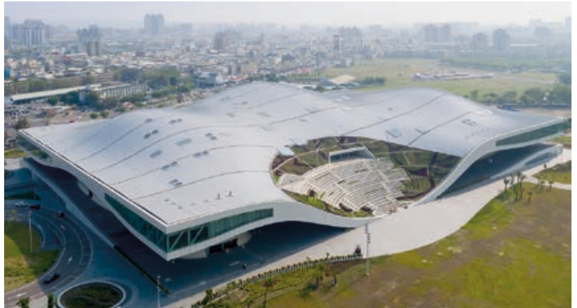
Kaohsiung Művészeti Központ / National Kaohsiung Centre for the Arts

Leginkább talán egy hatalmas hajó és egy bálna fúziójára emlékeztet a dél-tajvani Kaohsiung városában nemrég átadott megakomplexum, amely jelenleg „a világ legnagyobb előadó- és művészeti központja” cím birtokosa. Az épület a különös kialakításnak köszönhetően számtalan helyiséget foglal magában, többek között opera-, koncert-, színház- és előadótermek, valamint megannyi közösségi tér várja a központba látogatókat. A kecses vonalvezetésű megakomplexum körülbelül 7000 ember befogadására alkalmas. Az elmúlt években Tajvanban egymás után adtak át a különböző kulturális színtereket.