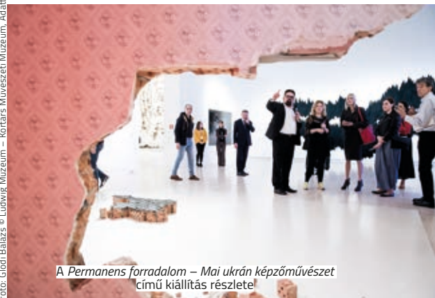
A Permanens forradalom – Mai ukrán képzőművészet című kiállítás részlete