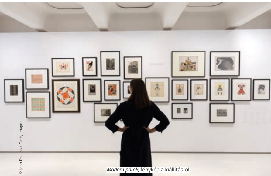
Modern párok, fénykép a kiállításról