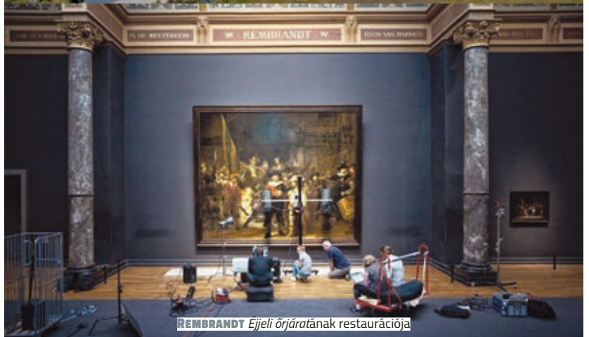
REMBRANDT Éjjeli őrkorlat ának restaurációja