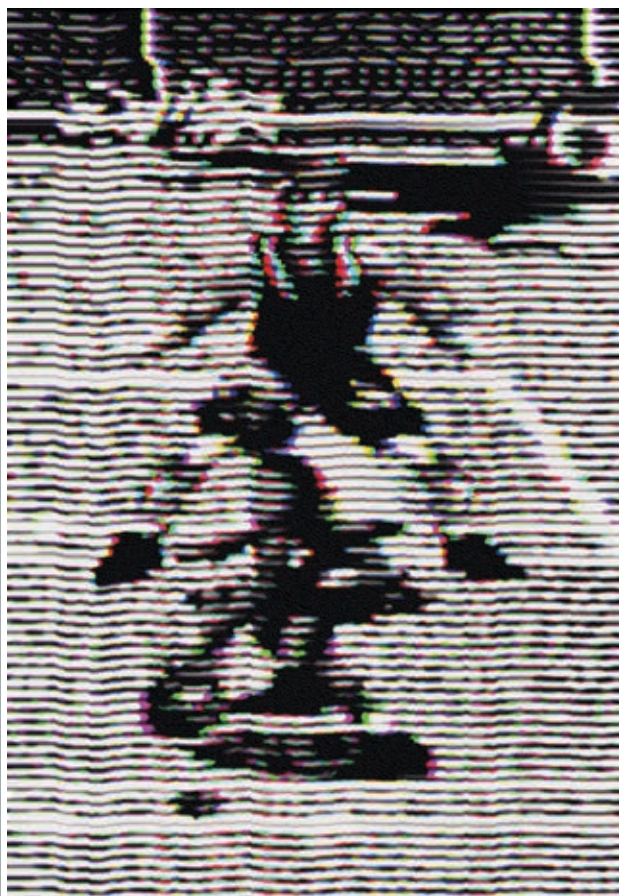
KAMIL ZALESKI: Ünnepély II , 2018, digitális nyomtatás, 70×100 cm

A lokális és univerzális fogalmak kapcsán gondolhatunk a világgazdaság szerveződésére, a földrajzi és kulturális határok elmosódására, főként arra, hogy a művészet és