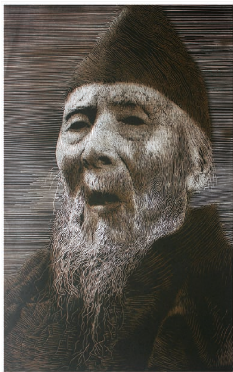
LIU JING: Mester 03-2 , 2017, fametszet, litográfia, 90×60 cm

tudnak. Így a lokális és univerzális egymás mellé helyezése által a gazdasági, politikai, ökológiai problémák közös, univerzális értékű gondokká, a helyspecifikus értékek globális értékeké válnak.