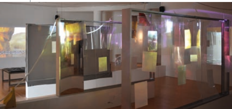
NEÍL BELOUFA: Global Agreement , 2018, videóinstalláció, részlet HUNGART © 2018

közeg mint téma további jelentésrétegeket is hordoz. Tudjuk, a harcászatban is az ultramodern technika és a fejlett technológia idejét éljük. Néhány éve még sci-finek tűntek a robothadseregekről alkotott víziók, mára pedig, bár egyelőre még nem jelentek meg, a fejlesztések eredményei igen meggyőzőek.