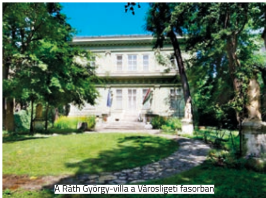
A Ráth György-villa a Városligeti fasorban

A Sotheby's aukciósház október 4-én értékesítette a színész és komikus Robin Williams, valamint egykori felesége művészeti gyűjteményét. Számos különleges darabbal találkozhatott, aki részt vett az aukción, hiszen képzőművészeti munkák, filmgyűjtemények, órák, designtárgyak és sportrelikviák is árverezésre kerültek. A tételek közt szerepelt Niki de Saint-Phalle több munkája, Banksy Boldog helikopterek című műve és Muhammad Ali dedikált boxkesztyűje is. Az előzetes becslések 3,3 és 4,7 millió dollár közötti értékesítési összeget állapítottak meg, amelyről a színész családja úgy döntött, hogy a jótékonyági szervezeteknek adományozza, illetve egy ösztöndíjalapot létesít a Juilliardon.