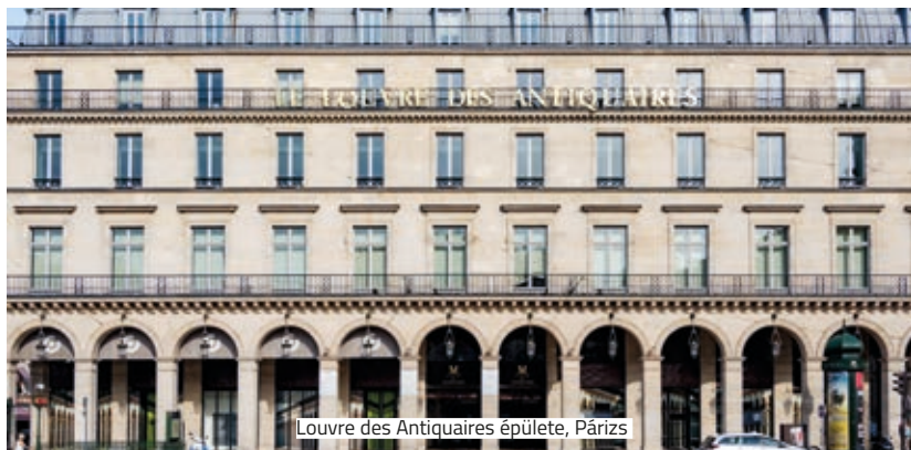
Louvre des Antiquaires épülete, Párizs

A Cartier Alapítvány egy új, az eddigieknél is hatalmasabb kiállítóter megnyitását tervezi Párizsban a régóta üresen álló Louvre des Antiquaires épület átvételével. A terveket Jean Nouvel készíti. Az intézmény várhatóan 2024-ben nyílik majd meg, és a város egyik legnagyobb művészeti tere lesz. Az alapítvány elnöke, Alain-Dominique Perrin szerint a létesítmény 65 ezer négyzetméternyi kiállítási területtel fog rendelkezni, amelyben állandó gyűjteményeknek is helyet kíván adni, stúdiókkal és mozival kiegészülve.