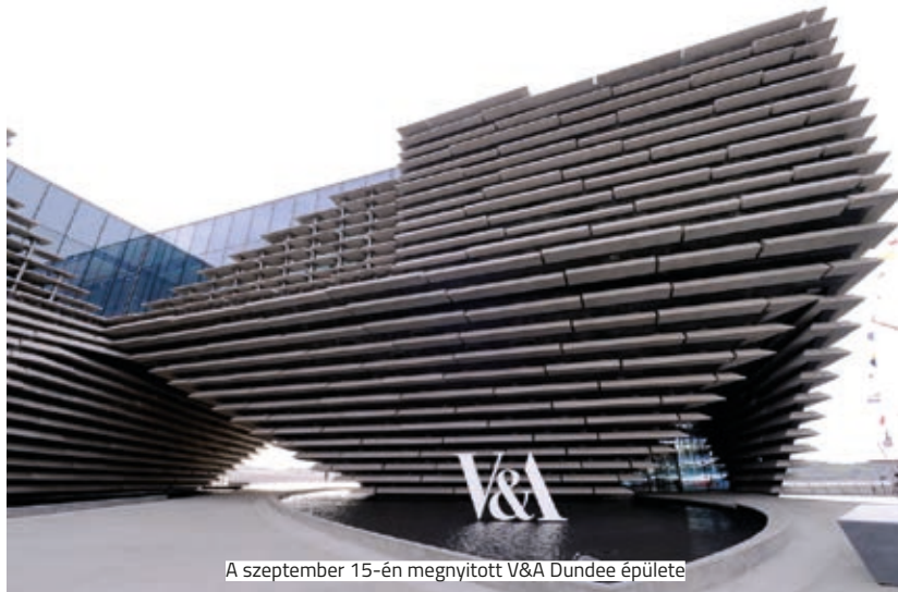
A szeptember 15-én megnyitott V&amp;A Dundee épülete

A londoni V&A Múzeum komoly ambíciókkal működik az 1852-es megalapítása óta. Szemléletükön most sem változtattak, megnyitották új, északi állomásukat, a V&A Dundee-t. Az épület felülete Északkelet-Skócia rétegzett sziklát idézi. Az építésznek, Kengo Kumának ez az első megvalósult projektje Nagy-Britanniában. A nagy méretű, 1100 négyzetméteres galériában különböző kiállítások, köztük a londoni V&A válogatott tárlatai is szerepelnek majd, míg a galéria kisebb osztásában egy 300 darabból álló állandó tárlat lesz látogatható, amely a skót design történetét mutatja be.