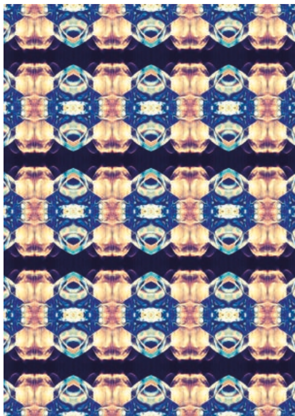
KUNVÁRI JANKA: Fényminta , 2018, digitális nyomat, 70×50 cm