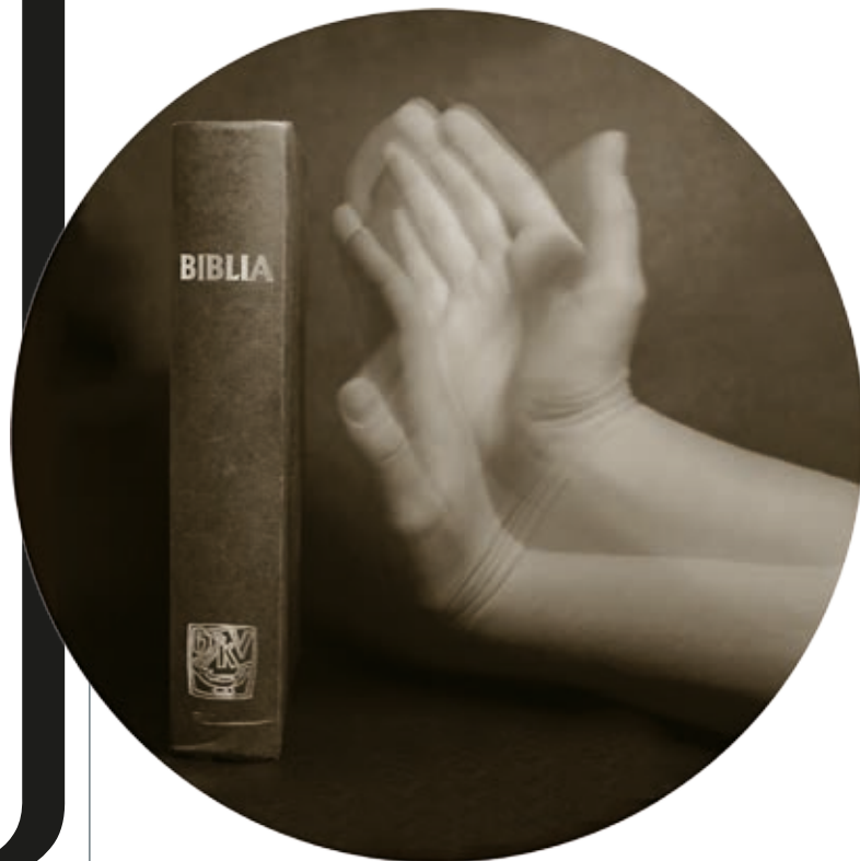
BIESS KATALIN: Biblia , 2017, fotó, gyclée-nyomat, 50×50 cm