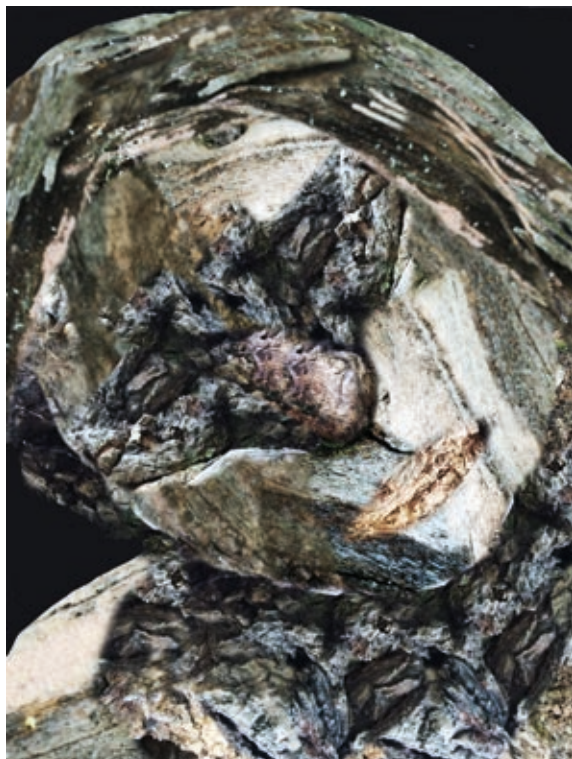
NÉMETH GÉZA: Portré 1. , 2017, komputergrafika, 70×50 cm

A kiállítás gazdag képi világának kínálatát szemlélve felmerül a gondolat (és az igény is megfogalmazódik), hogy a két dimenzióban megjelenő statikus, nyomtatott munkák közül jó néhánynak erőteljesebb megjelenítését jól szolgálná az összetettebb technikát igénylő médiumok használata. Itt jutunk vissza a németországi hasonlathoz és ahhoz a felismeréshez, amivel a világ más tájain a művészek egy része rendelkezik, és ami nem más, mint a fejlett és drága technikai eszközökhöz való szabad hozzáférés.